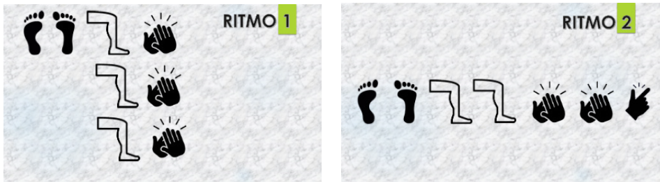
Figura 7. Ritmos corporales para realizar en la actividad 7