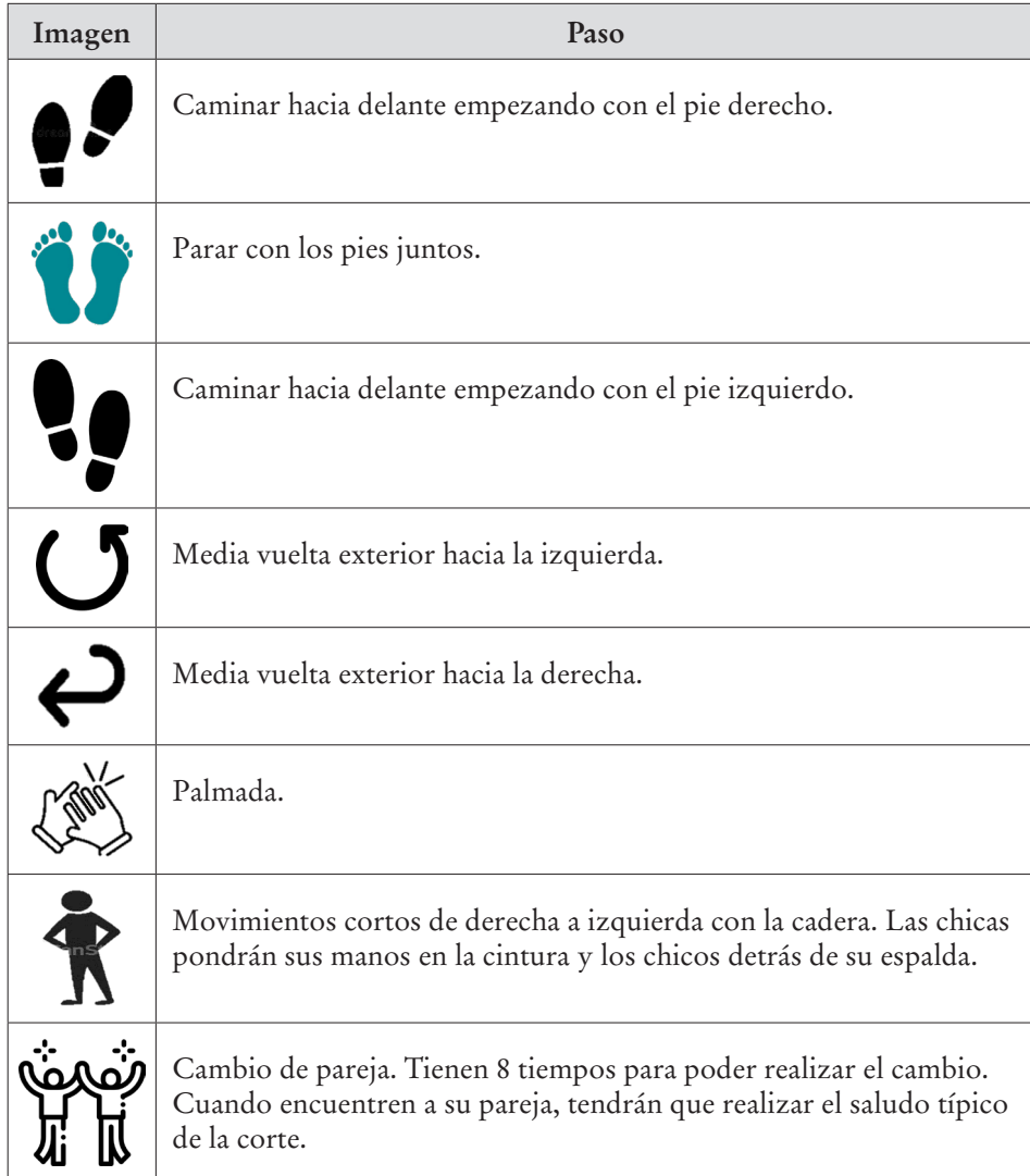
Figura 3. Significado de los iconos para los pasos de la danza

desarrollo de la capacidad de actuar, los estímulos individuales, colectivos, biológicos, intelectuales y el desarrollo socioemocional y de la sensibilidad y creatividad.