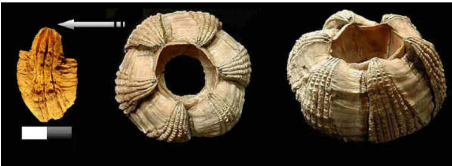
Figura 5. Izquierda: Las Caldas (Oviedo, Asturias). Magdaleniense. Placa de balano de la especie Coronula diadema ; Derecha: Ejemplar actual de la misma especie.

Particularmente es interesante y único el resto de balano documentado en los niveles de Magdaleniense medio de Las Caldas. Pertenece a Coronula diadema (Linnaeus, 1758), especie parásita que vive exclusivamente sobre las ballenas, en cuya piel se enraíza. Su presencia en el yacimiento es una prueba del posible acarreo de trozos de carne de cetáceo con piel, ya que no es posible desprender el cirrípedo sin cortar dicha carne (Corchón et al., 2008) (Figura 5)