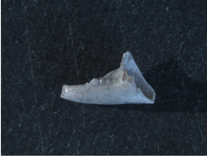
Figura 2. Los Gitanos de Montealegre (Sámano, Cantabria). Neolítico. Pinza de cangrejo de la especie Pachygrapsus marmoratus . Tamaño: 6mm.

sido pescada en pesquerías. La utilización de este tipo de estructuras antrópicas explicaría también la presencia de determinadas especies de peces en el yacimiento.