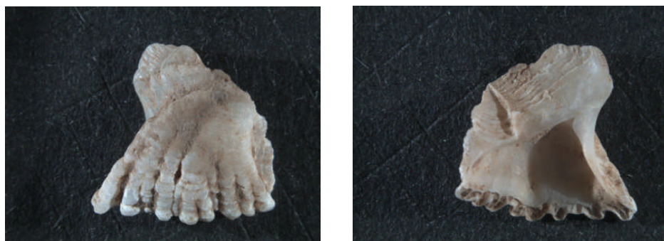
Figura 4. La Garma A (Omoño, Cantabria). Magdalenense. Placa de balano de la especie Semibalanus balanoides . Tamaño: 7,5 mm.

Pero, aunque carecen de valor alimenticio, estos crustáceos nos dan datos de tipo paleoclimático y acerca del lugar de la costa (zonas más o menos expuestas) en el que han sido recolectadas las diferentes especies de moluscos sobre las que habitan. Así, por ejemplo, la clasificación de especies boreales Semibalanus balanoides (Linnaeus, 1767) en el Magdalenense inferior de Altamira y en el Magdalenense medio de La Garma A y de Balanus crenatus (Brugière, 1789) en el último yacimiento citado, indicarían que la temperatura del agua del mar sería más fría que en la actualidad y que los moluscos sobre los que vivían ( Patella sp.) fueron recogidos en zonas muy batidas por el mar (Álvarez Fernández, 2009; i. p. 3) ( Figura 4 ). En los yacimientos mesolíticos franceses de Beg-er-Vil y Beg-an-Dochenn la presencia masiva de la especie de aguas cálidas Balanus perforatus (Brugière, 1789) indicaría que los moluscos y otros organismos sobre los que han sido documentados proceden de la zona infralitoral, es decir de una zona muy batida por el mar (Dupont et Gruet 2005).