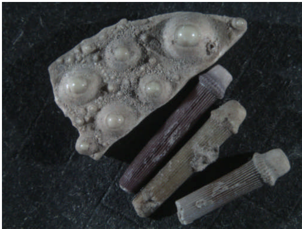
Figura 6. Los Gitanos de Montealegre (Sámano, Cantabria). Neolítico. Placas y púas de la especie Paracentrotus lividus . Tamaño: 15 mm

Esta especie ha sido reconocida en sitios como la Garma A (Magdaleniense) o Los Gitanos de Montealegre ( Figura 6 ). En La Garma A, además de placas y púas, hemos documentado otras partes anatómicas (placas hemipiramidales, rótulas, aurículas) que nos permitirán identificar las especies recogidas y calcular el NMI, tal como se ha hecho a otros yacimientos como el francés de Bahía de Lannion, de época romana (Campbell, 2008). En los niveles neolíticos y calcolítico de Los Gitanos su clasificación a nivel de especie se ha realizado por la distribución de los tubérculos de las placas y las estriaciones y protuberancias en forma de alubia de las púas. La ausencia de partes anatómicas características y la extrema fragmentación de las placas impide hacer el cálculo del NMI. Esto, unido a la escasez de restos por nivel arqueológico nos hace dudar de su recogida directa por parte de los grupos humanos en el mar. Sería más probable que estos restos formasen parte del alimento de las especies ictológicas capturadas en la costa y transportadas a la cueva.