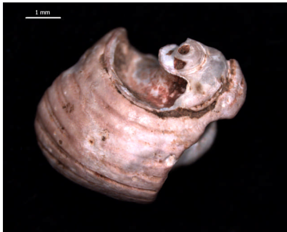
Figura 1. La Garma A (Omoño, Cantabria). Magdalenense. Ejemplar de Homalopoma sanguineum .

Otro ejemplo de recogida sistemática de restos malacológicos procede de las investigaciones llevadas a cabo en distintos concheros holocenos del NE de Asturias. Aquí, se han desmenuzado las concreciones calcáreas que engloban diferentes restos de origen animal, documentándose los primeros objetos de adorno-colgantes mesolíticos en este tipo de contextos. Así, en La Poza l'Egua, hemos identificado dos conchas marinas perforadas de las especies Littorina obtusata (Linnaeus, 1758) y Nassarius reticulatus (Linnaeus, 1758), además de otros restos de origen marino (vértebras de peces, púas y placas de erizos de mar, etc.) (Arias Cabal, P., et al., 2007).