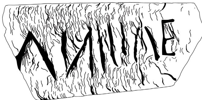
FIG. 2. Fotografía y dibujo del epígrafe hallado en el Cortinal de San Juan.

conservan siete caracteres de diversos tamaños labrados con un cincel grueso y metálico. El reverso no presenta ninguna modificación antrópica.