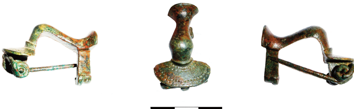
FIG. 2. Fibula de rodilla con cabecera semicircular procedente de Hijes.

Se han fechado genéricamente entre mediados del s. II y el s. III d. C. (Kropf y Nowak, 1998-1999: 30), aunque el momento de inicio del modelo de cabecera semicircular ha sido objeto de debate. Jobst (1975: 66) defendió la difusión de este subtipo en la segunda mitad del s. II, mientras otros investigadores han propuesto una cronología algo más temprana, como Berecz (1991: 165), que sostuvo el inicio de su fabricación a comienzos de dicha centuria y su perduración hasta principios del s. III. Otros autores han defendido también una cronología temprana, proponiendo que su aparición se produjo en época de Adriano y que su uso perduró solamente hasta finales del s. II (Riha, 1979: 84, 85, 159).