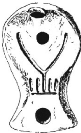
FIG. 1. Materiales recuperados en Hijes (Guadalajara): 1) molino circular de granito encontrado durante las prospecciones de 2010 y 2) lucerna conservada en el MAN, Madrid.

forma Dressel 22 (Fig. 1.2) en forma de lira de cuerpo aplanado y ansa transversal con infundibulum , decorada con incisiones (Amaré, 1987: 11, 28) y en el Museo de Molina de Aragón están depositadas dos pesas metálicas, una de bronce con decoración estriada y otra de hierro de forma troncocónica 4 . Se sabe que también había monedas porque las cartas de la Comisión indican que durante la campaña de 1845 se descubrieron tres: “dos del Emperador Graciano y la otra de Constantino Pío Félix Augusto” (Gómez-Pantoja y López, 2004: 157).