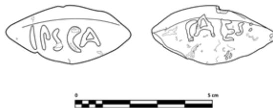
FIG. 5. Dibujo de la glans inscripta localizada en Montilla.