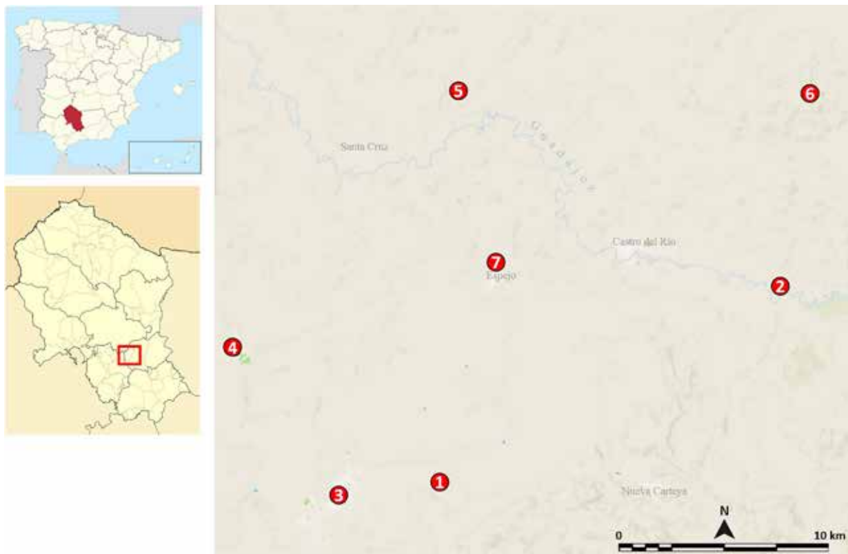
FIG. 1. Principales lugares citados en el texto: 1) Navilla de Cortijo Blanco, lugar de hallazgo de la glans inscripta aquí presentada; 2) yacimiento de Ipsca; 3) Montilla; 4) Ulia Fidentia, actual Montemayor; 5) Ategua; 6) Torreparedones, Baena; 7) Espejo (elaboración propia sobre base cartográfica del IGN).