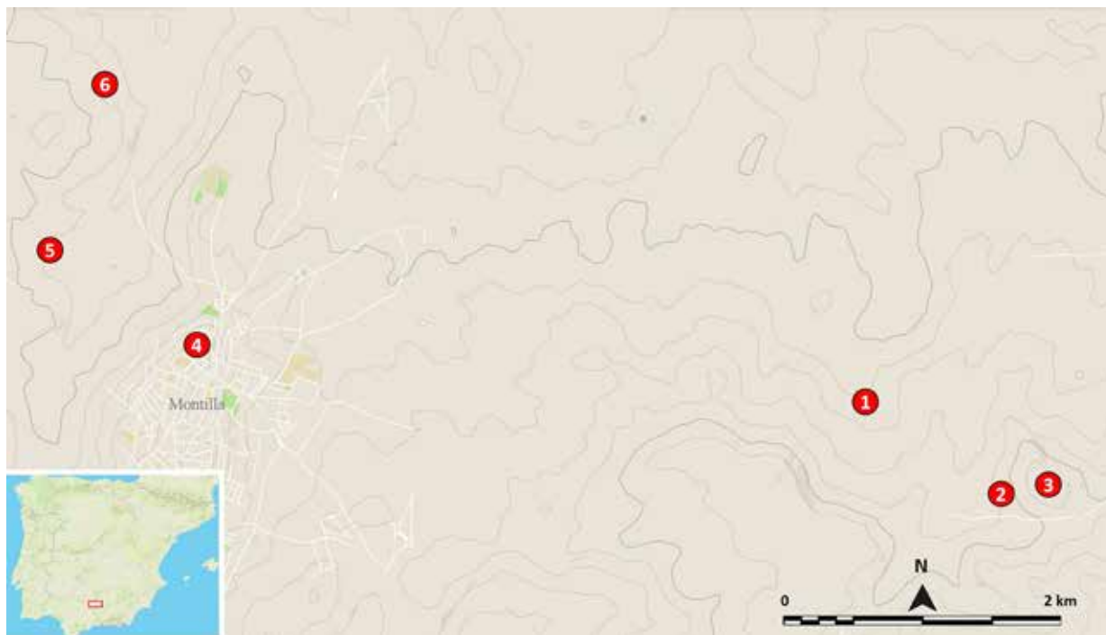
FIG. 2. Localización de los hallazgos en el entorno inmediato de Montilla de glandes con contexto espacial conocido; la numeración de 1-6 se corresponde con la de la tabla recogida en la siguiente figura (elaboración propia sobre base cartográfica del IGN).

otra pérdida parcial de masa provocada también por un golpe en el extremo menos apuntado, que podría deberse, en este caso, al impacto del proyectil con alguna superficie dura cuando fue utilizado como arma arrojadiza, si tenemos en cuenta el ángulo de la fractura y que está muy rodado. Por lo demás, la superficie de plomo presenta, como es habitual, una serie de concreciones y pequeñas pérdidas de masa a lo largo de todo el cuerpo que no dificultan la lectura de las dos inscripciones que porta en ambos lados.