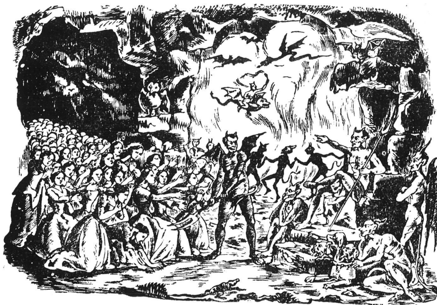
Capçalera d'un romanç vuitcentista. Col·lecció J. Amades).

El poc valor de saviesa que la gent creu que té el diable és filla de l'experiència adquirida per efecte de la seva gran vellesa i no pas com do natural; ens diu el refrany en aquest sentit: