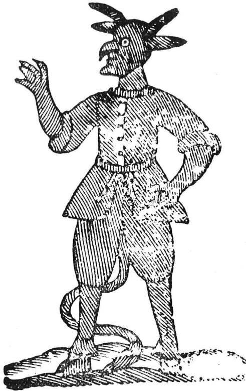
Xilografia setcentista (Col. J. Amades).

Per a formar part de la secta diabòlica era precis renunciar a la fe cristiana i entrar amb pactes amb el diable. El diable marcava els seus afiliats amb un senyal semblant a una pota de gripau o de