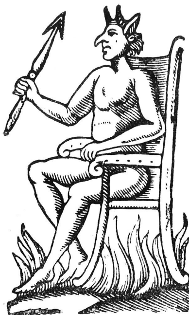
Xilografia setcentista per il·lustrar literatura de fil i canya (Col. J. Amades).

físics i les reaccions químiques que avui són familiars als infants de les nostres escoles i que aleshores només es feien explicables per una intervenció demoníaca, i tot allò que resulta tan clar i tan fàcil com posar oli a un llum era tingut per art del dimoni , i hom ho mirava amb basarda i repugnava el veure-ho i el saber-ne portat per una paüra innata al desconegut que hom tem sense saber per que. El gas fou considerat com art del dimoni i la gent temia adaptar-lo perquè