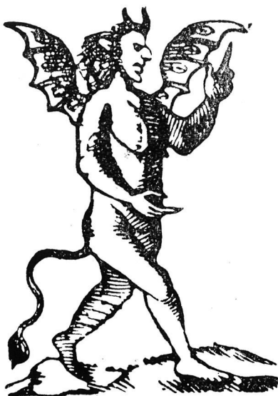
Xilografia setcentista (Col. J. Amades).

determina i ha donat origen a diversos apel·latius curiosos entre d'altres al de banyeta , maligne , boc o bèstia boc i peu forcat , amb al·lusió al supòsit de que una de les fomes licantròpiques preferides és la de boc i té per tant els peus forcats com aquest. També s'el·lo qualifica d' àngel merlenc , és a dir blau, ço que suposa si se l'havia cregut de pell o pèl d'aquesta color així com avui es creu que és