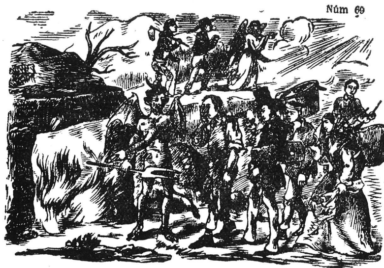
Capçalera de romanç vuitcentista.

El dia que hom creu pitjor per als afers relacionats amb el diable és divendres. Cada divendres mor un diable vell i en neix un altre per tal de que sempre hi hagi els mateixos. Si hom troba una moneda