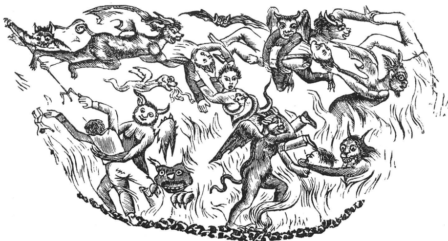
Capçalera d'un romanç vuitcentista.

Per donar una somera-idea de la varietat de facultats i poders atribuïts pel poble al dimoni i de com s'imagina el seu costumari