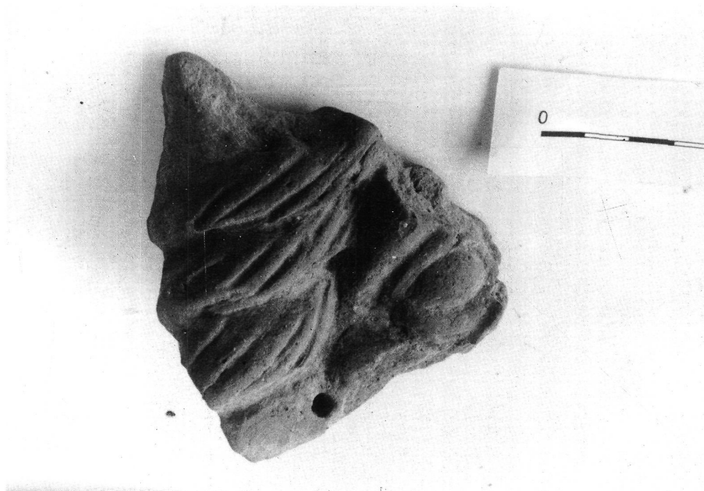
Fig. 4: Sàtir.