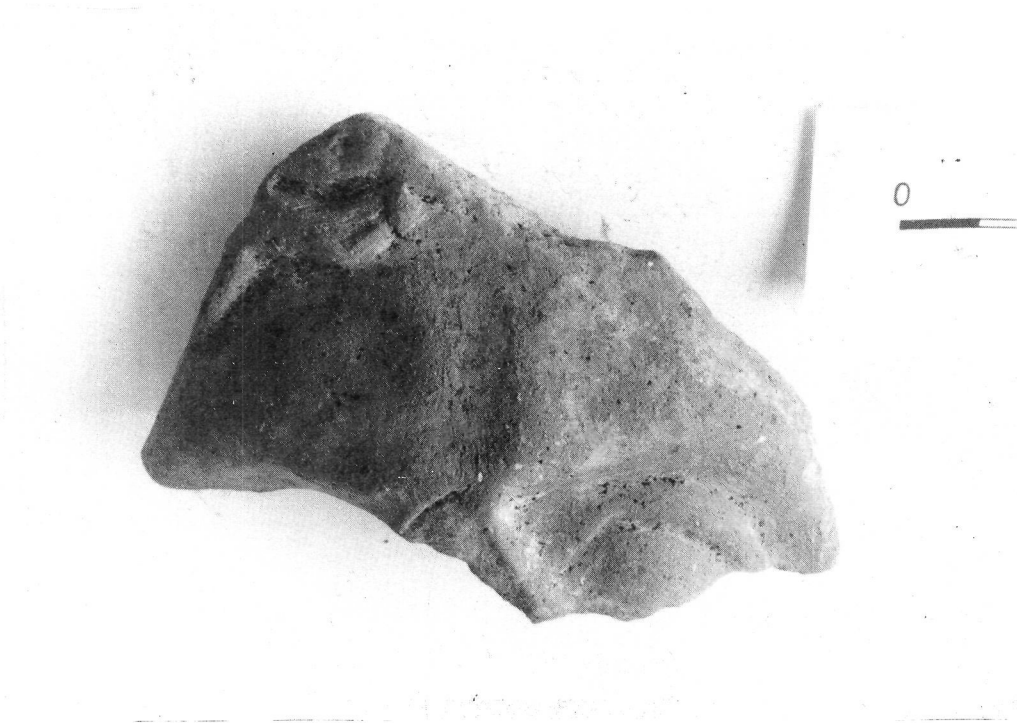
Fig. 1: Màscara idealitzant.