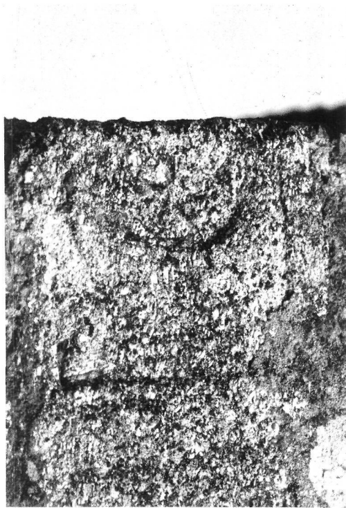
Foto 3. Detalle de la decoración.