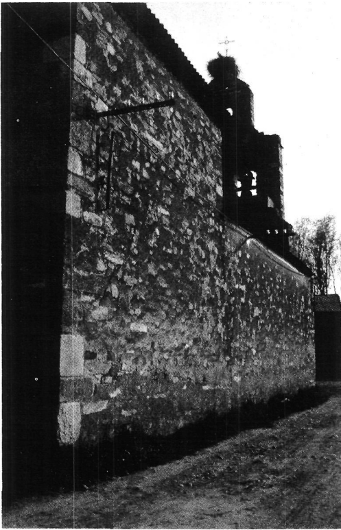
Foto 1. Esquina de la cabecera de la iglesia en la que se encuentra la inscripción.