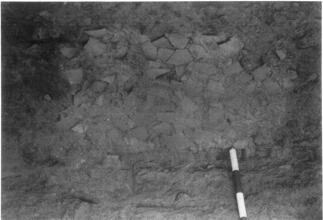
Lámina I. 1: Vista general de los departamentos. 2: Lecho de fragmentos de cerámica del hogar del departamento 5.