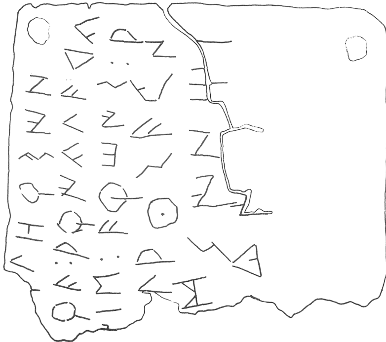
FIG. 2.—Calco del bronce de S. Antonio