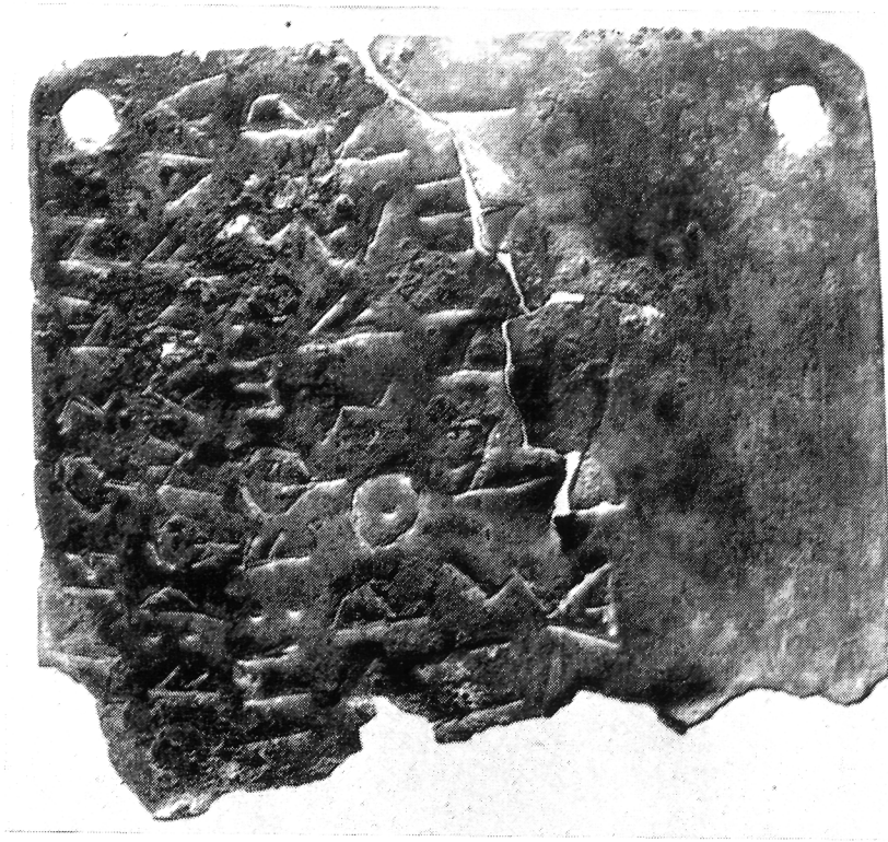
LÁM. I.—Fotografía, a su tamaño, del bronce de S. Antonio