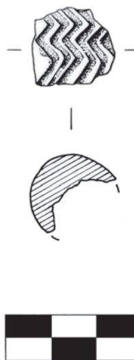
FIG. 5. Pieza 2. Fragmento de un posible oculado en hueso, Povoado Fonte Quente, Tomar.

como ídolo viene determinada por su asociación, en un principio, al ámbito funerario, y oculado , por la representación temática que los define: unos grandes ojos. Suelen aparecer sobre soportes diversificados como hueso, piedra y cerámica, tanto en ambientes funerarios como domésticos.