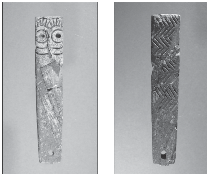
FIG. 2. Pieza 1. Oculado en hueso anverso y reverso, Povoado Fonte Quente, Tomar.

Elemento 1 (Figs. 2 y 3)– Se trata de un oculado sobre hueso de forma rectangular alargada y sección plana que se ensancha ligeramente en el extremo superior. En el anverso, que ocupa el tercio superior