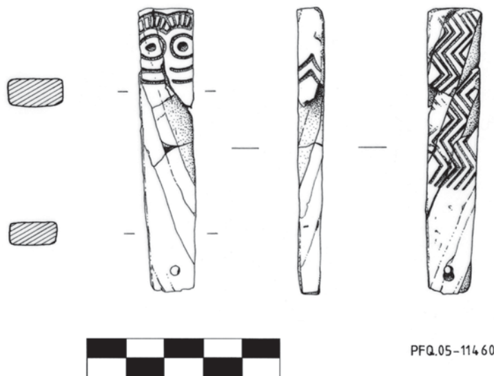
FIG. 3. Pieza 1. Oculado en hueso, Povoado Fonte Quente, Tomar.