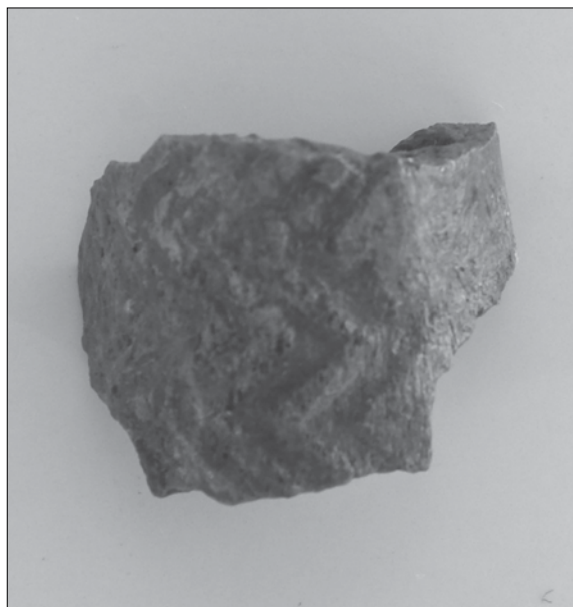
FIG. 4. Pieza 1. Fragmento de un posible oculado en hueso, Povoado Fonte Quente, Tomar.