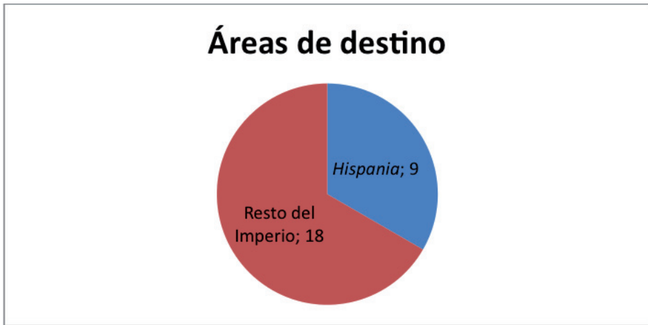
Gráfico n.º 2. Distribución de militares en función de las áreas de destino

Los áreas de destino donde tenemos documentados a los 27 milites lusitanos reunidos en este trabajo presentan una importante variedad. Su presencia se constata tanto en Hispania , donde conocemos 9 testimonios, como en el resto del Imperio, de donde proceden la mayoría de los personajes estudiados, un total de 18, tal y como podemos ver en el gráfico n.º 2.