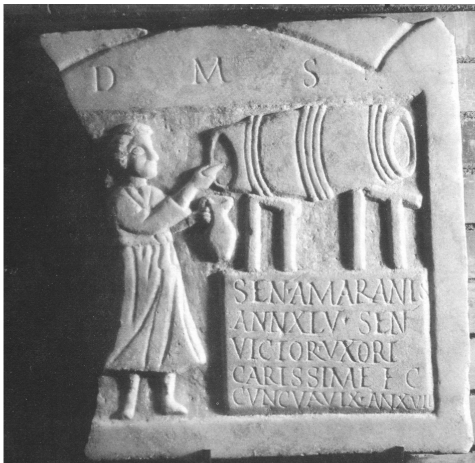
FIG. 3. Inscripción de Sentia Amaranta (MNAR)

larum publicorum collegae pusieron un monumento, procedente de Emerita Augusta 96 , en conmemoración de una compañera liberta, lo cual confirma su pertenencia a una cofradía de tipo privado, que les permitía gozar de una determinada distinción respecto a las libertas privadas.