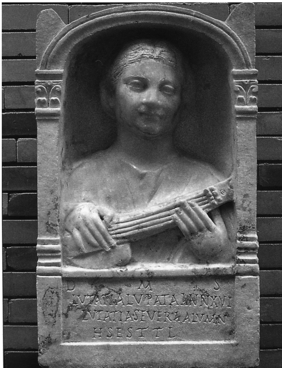
FIG. 4. Inscripción de Lutatia Lupata (MNAR)