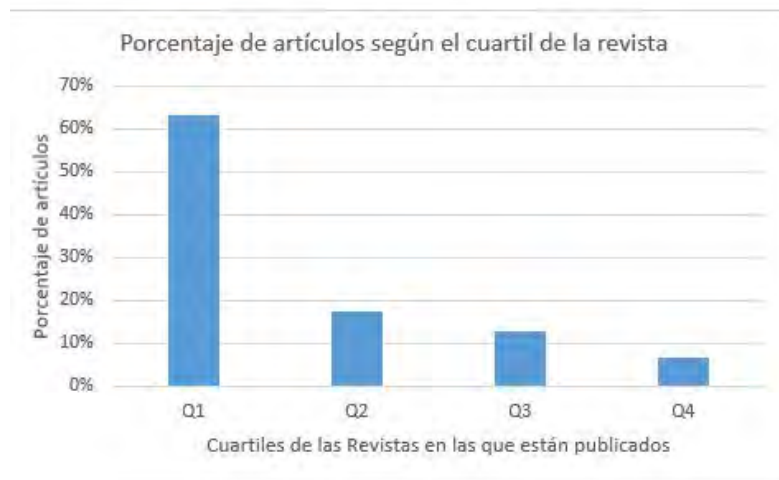
Figura 4. Porcentaje de artículos según el cuartil de la revista.

A partir de los resultados presentados en la Figura 2, la Figura 4 representa el porcentaje de artículos que han sido publicados en cada uno de los cuartiles existentes. Se ha podido observar como el 63% de los 135 artículos referidos a artículos de revistas son publicados en revistas Q1. Este porcentaje es solo del 17% en el caso de las revistas del Q2.