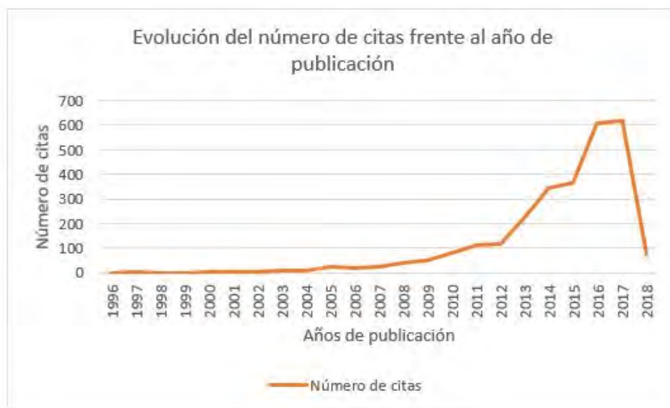
Figura 2. Evolución del número de citas por años.

El primero de los indicadores es la evolución temporal del número de citas con respecto al año de publicación. Como se presenta en la Figura 2 a partir del año 2011 se produce un incremento del número de citas en un 25%, de 82 citas en el 2010 a 110 citas en el 2011. A partir de este momento el incremento de citas aumenta anualmente, alcanzando el máximo en 2017 con 618 citas.