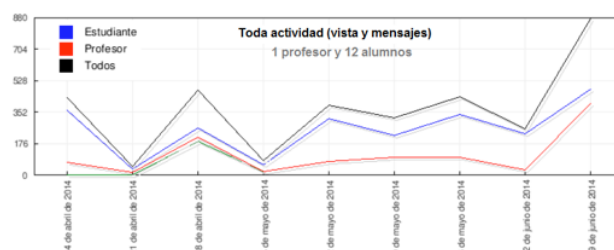
Fig. 3.. Analítica de uso de UBUVirtual.

Como evidencia de interacción con las e-actividades implementadas en el entorno virtual de aprendizaje, en la Fig. 3 se muestra