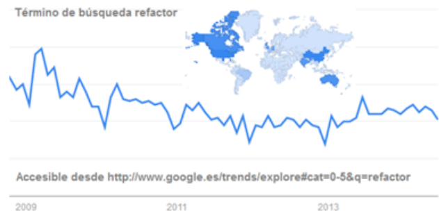
Fig. 1. Tendencias término de búsqueda "refactor", categoría "informática electrónica".

com), como bibliográfica (Brown, 1998), (Fowler et al. , 1999), (Lippert & Roock, 2006), (Wake, 2004).