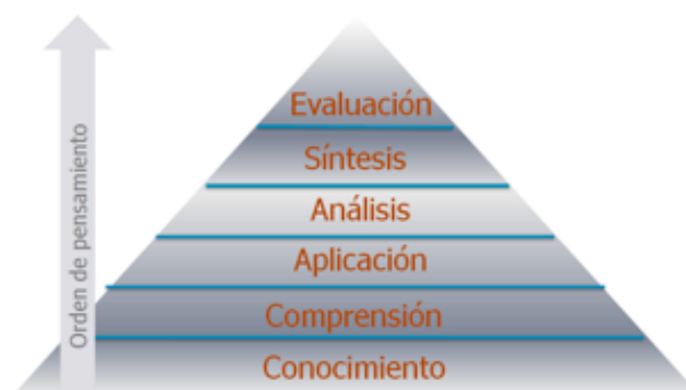
Fig. 2. Orden de pensamiento de la taxonomía de Bloom.

En concreto, en este trabajo se definirán un conjunto de e-actividades que persiguen cubrir los niveles de la taxonomía de Bloom: conocimiento, comprensión, aplicación, análisis, síntesis y evaluación. Cada