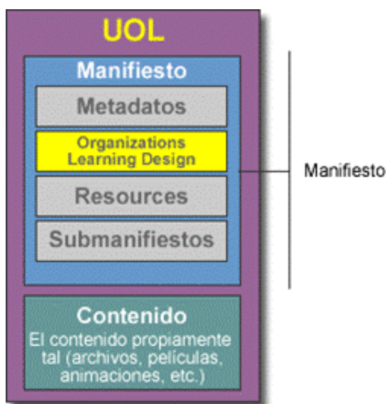
Imagen 3 - Estructura de una Unidad de Aprendizaje (UOL) en IMS Learning Design

Posteriormente, dicho archivo XML debe ser cargado y reproducido por un "Reproductor de Diseños de Aprendizaje" ( Learning Design Player ) que permita asignar usuarios o personas a los distintos roles para que éstos ejecuten, a través del mismo Reproductor, las actividades dentro de un ambiente. El reproductor