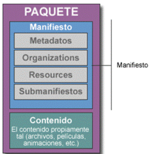
Imagen 2 - Estructura de un paquete IMS Content Packaging

Para facilitar su desarrollo e implementación una Unidad de Aprendizaje toma la idea de un paquete de contenidos de IMS Content Packaging (IMS, 2003). Ver Imagen 2 e Imagen 3.