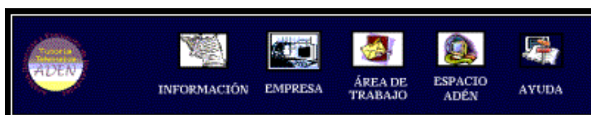
Figura 2: Menú Principal de Navegación de la Tutoría A.D.E.N.

Los tres caminos que constituyen la Tutoría A.D.E.N. se han organizado en cinco unidades temáticas básicas de funcionamiento que conforman el índice temático, apareciendo siempre visible como menú de navegación, evitando que el usuario se pierda por las páginas y permitiendo así el máximo aprovechamiento de la sesión de tutoría y la rápida habituación a la navegación. Igualmente, todos los hipervínculos son a no más de 3 niveles por este motivo. Con este fin también se ha creado una de las unidades temáticas: “Ayuda”, similar para los tres usuarios, donde además de establecer el mapa de navegación adaptado para cada uno de ellos, da información precisa sobre la filosofía del diseño y los botones principales de navegación.