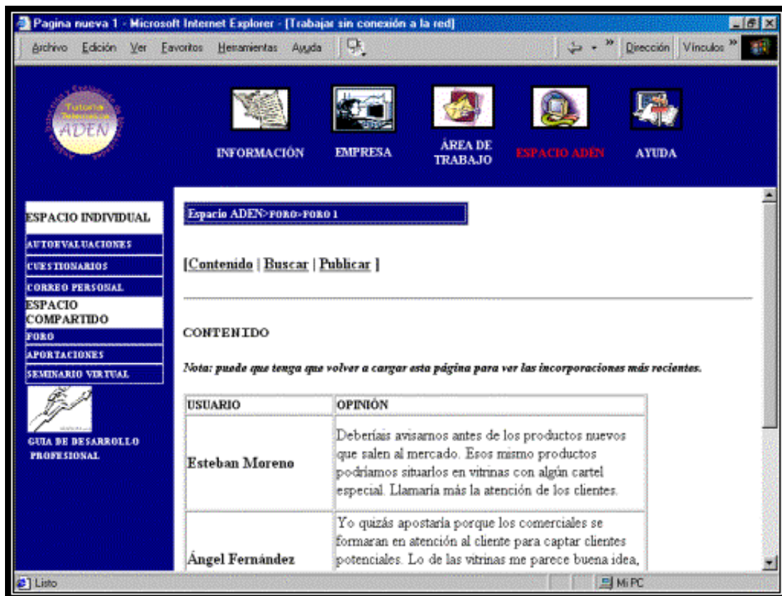
Figura 6: Unidad Espacio ADEN. Foro general.

. Foro General: Espacio de compartición de ideas, información y conocimientos, guiado por el tutor, que permite la recogida de información y la participación de todos los miembros, el diagnóstico y las posteriores acciones formativas. Es un foro general en el que se podrán marcar los temas a tratar y donde podrán participar todos los tutorizados.