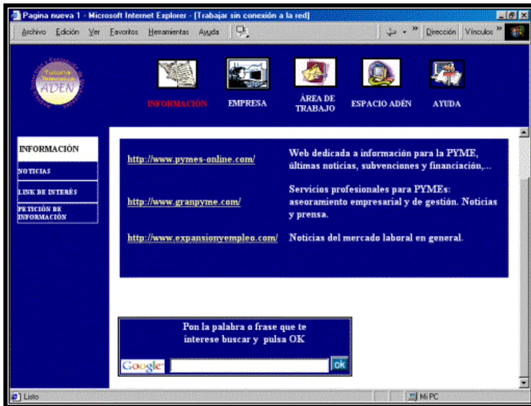
Figura 4: Unidad de Información. Link de Interés.