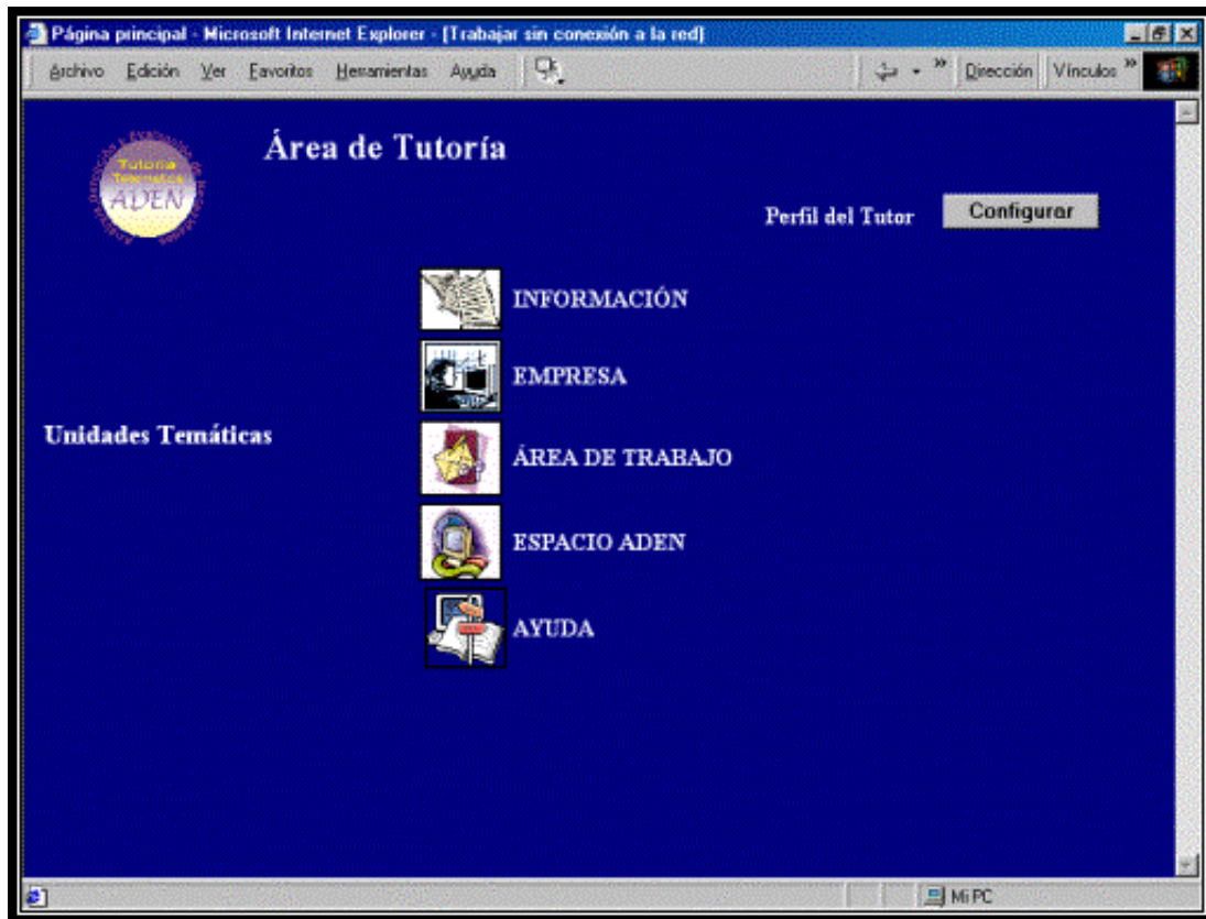
Figura 3: Página principal del Tutor. Área de tutoría.

posición, abriendo sus opiniones con la posibilidad de generar planes colaborativos y agrupados entre varias PYMEs, tanto en temas formativos como en otros que puedan considerarse oportunos. El usuario Tutor, al ser el gestor de la tutoría será el encargado de modificar y actualizar toda las informaciones, incluyendo en su camino varias subunidades que iremos describiendo a continuación por áreas.