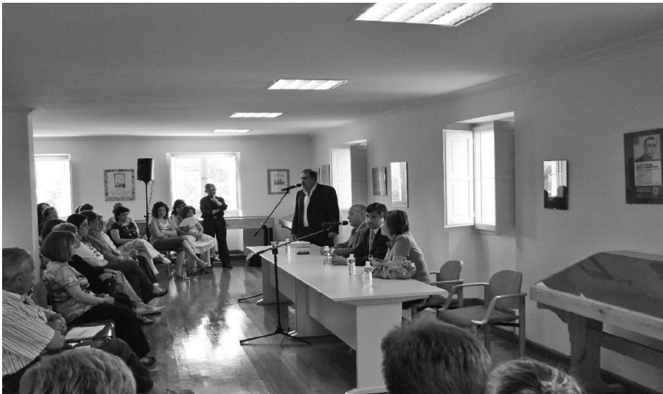
ILUSTRACIÓN 2: Entrega de diplomas de la Casa de Cultura de Polanco.

Cultura de Polanco. El Centro de Recursos, Interpretación y Estudios de la Escuela ha cedido sus instalaciones para entrega de títulos, presentaciones, etc.