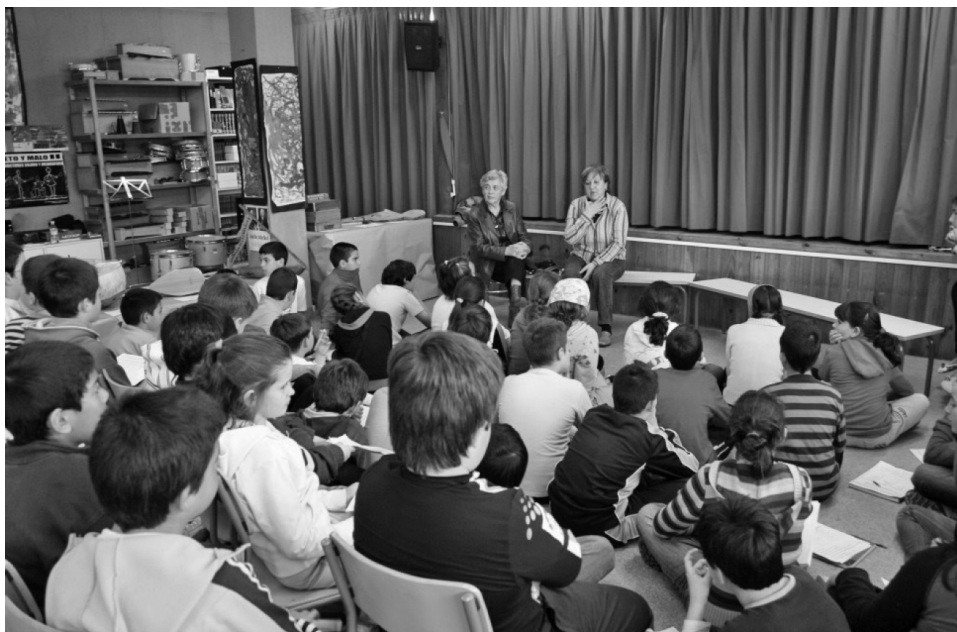
ILUSTRACIÓN 5: Charla de las abuelas a los alumnos sobre su experiencia escolar.