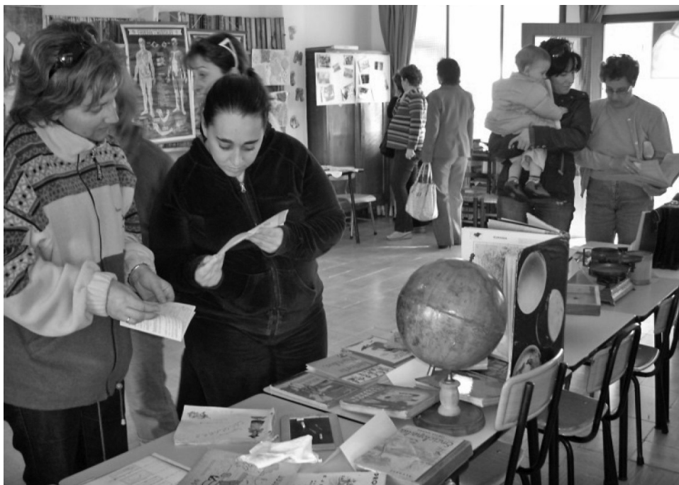
ILUSTRACIÓN 4: Colaboración de las familias en la exposición temporal.