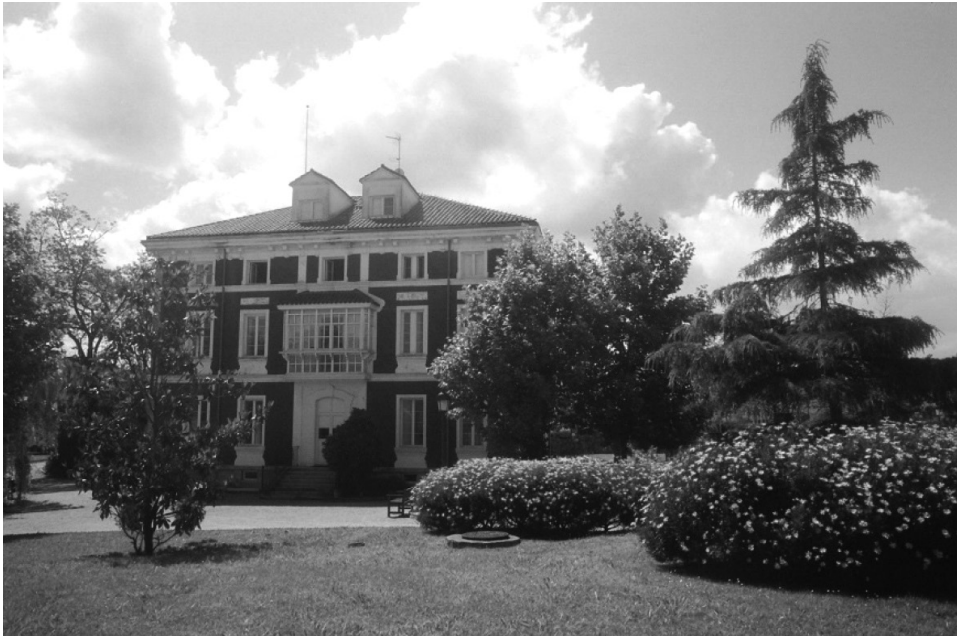
ILUSTRACIÓN 1: Edificio del CRIEME y jardines.

Cultura de Polanco. El Centro de Recursos, Interpretación y Estudios de la Escuela ha cedido sus instalaciones para entrega de títulos, presentaciones, etc.