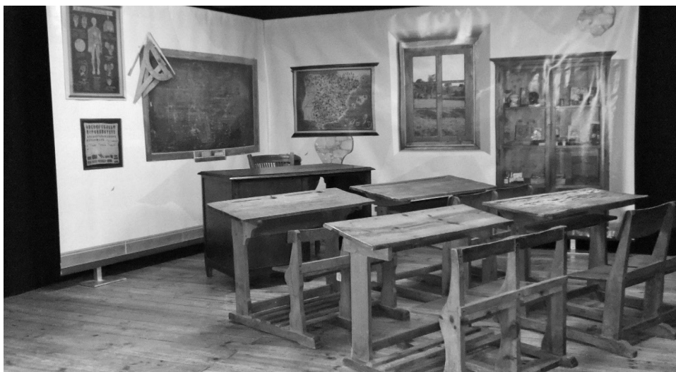
ILUSTRACIÓN 6: Imagen del escenario para la representación de la obra Más listos que el hambre, de Juan José Crespo.

La representación ha hecho que se incremente la relación de los padres y el centro educativo, que el centro haya sido un generador de actividad cultural para la población y, en algunos casos, que las familias se impliquen en el proceso educativo colaborando en la ejecución de la obra.