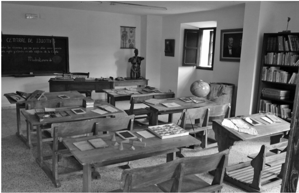
ILUSTRACIÓN 7: Fotografía del aula museo de Pesquera.

Este conjunto, de valioso interés cultural de la zona, lo hace especialmente óptimo para la generación de actividades con el alumnado de la comunidad, así como para la afluencia de un turismo de calidad que servirá para dinamizar y dar valor a una zona que no llega al centenar de habitantes.