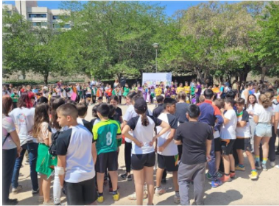
FIGURA 5. Lectura del manifiesto con alumnado de centros escolares, institutos y UV

Para finalizar, y tras leer el manifiesto de la SAME 2023, se dejó constancia del lema #TransformAcciónEnIgualdad formando el símbolo humano del género femenino, mostrando los trabajos realizados por el alumnado de los centros de Educación Primaria, en el que presentaban la figura de una mujer, jornada en la que llegaron a participar unas 300 personas.