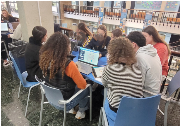
FIGURA 2. Alumnado trabajando en la acción formativa del curso 2022-23

Una vez explicada la campaña, los grupos, compuestos entre seis y ocho personas, se organizan para trabajar en la actividad. Pueden realizarla tanto en el aula como en