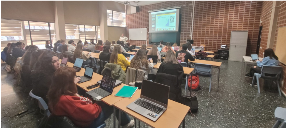
FIGURA 1. Alumnado del Grado de 1.º de Educación Social

Podemos observar una sesión de la acción formativa en el aula con un grupo de Educación Social de la Facultad de Filosofía y Ciencias de la Educación de la Universitat de València durante el curso 2022-23.