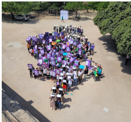
FIGURA 6. Formación del símbolo del género femenino como cierre de la jornada

La evaluación del proyecto se realiza tanto de forma interna como externa por parte del organismo que concede las ayudas de innovación docente; igualmente, se realizan procesos de evaluación con una metodología mixta que combina tanto el diseño e implementación de un cuestionario had hoc creado en la plataforma Lime Survey de la Universitat de Valencia (Ancheta-Arrabal et al. , 2023), dirigido a medir aspectos tales como la satisfacción, la participación en las acciones formativas, los conocimientos adquiridos, así como su adecuación y motivación; como el foro de