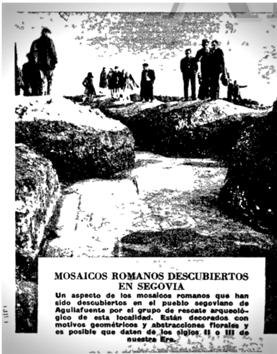
5. Fotografía publicada en el ABC del 17 de enero de 1968.

parecer ya lo estaban en 1868— y las palabras «Eufrata» y «Tagus». Se advertía de la existencia en otro sector próximo de mosaicos, con dibujos geométricos, y se ponía en conocimiento de los lectores de la exhumación en la misma zona de restos arquitectónicos, de un pavimento que pudiera ser una calzada y de restos