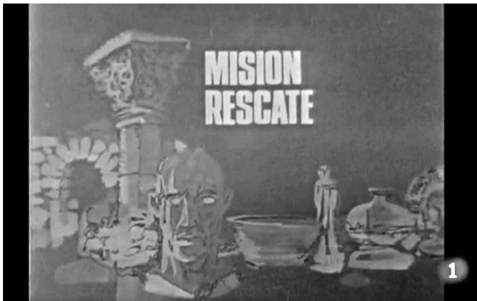
2. Cabecera del programa en RTVE.

La motivación y el interés entre los jóvenes concursantes surgía, por tanto, de su conexión directa con el entorno, de su vínculo personal con los proyectos de rescate propuestos por sus maestros, convirtiéndose en proyectos significativos a través de la vinculación entre patrimonio y emoción.