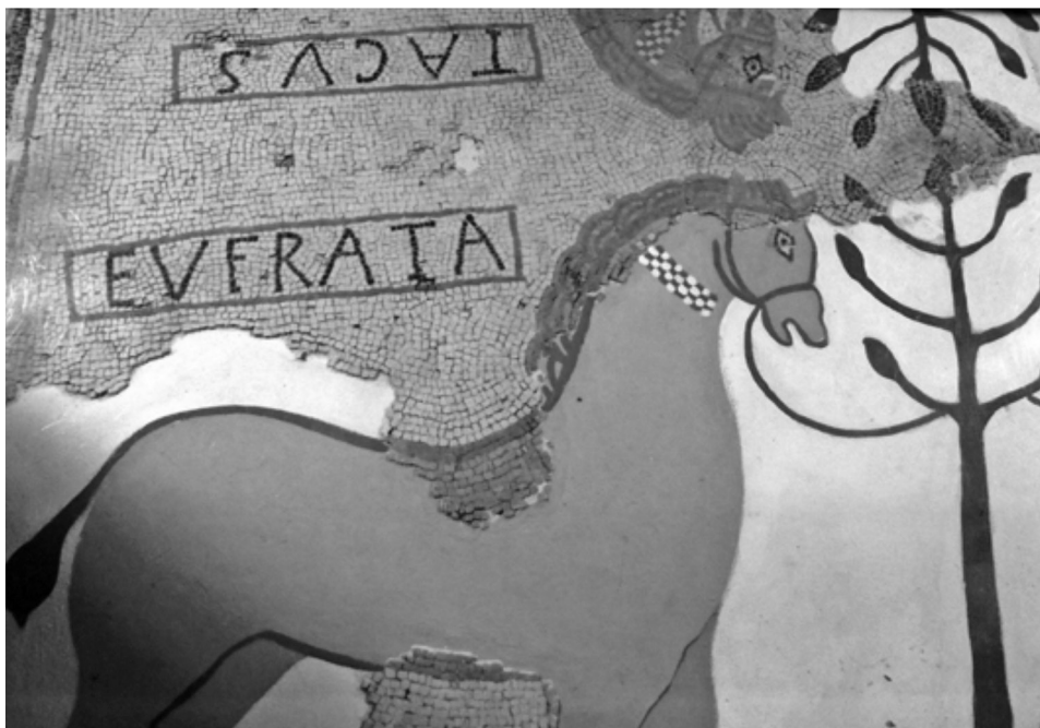
6. Detalle del mosaico de los caballos de Aguilafuente (Segovia). Autora: Laura Frías Alonso.

humanos. También La Vanguardia se hacía eco del hallazgo ampliando la información con la noticia de la reciente visita del secretario técnico del Instituto Central de Restauraciones de Obras de Arte y Arqueología junto a otro especialista, cuyo nombre no aparece en la citada publicación, y junto al delegado provincial de Bellas Artes 26 .