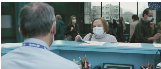
Foto 11: el Departamento de Defensa del Ciudadano del Gobierno de Québec

En primer lugar, Leblanc trabaja como funcionario del “Departamento de Defensa del Ciudadano”, del Gobierno de Québec (foto 11), una institución estatal “orwelliana”, invadida por la corrección política. En el edificio donde está radicado hay una auténtica persecución de los fumadores por parte del personal de seguridad. La defensa de lo “políticamente correcto” se ejemplariza en la película en un incidente, el provocado por Jean Marc al decir que su compañero de trabajo afro-americano “trabajaba como un negro”, por el que se le abre un expediente sancionador. La cinta representa muy bien la burocracia que dificulta las reclamaciones del ciudadano en un departamento que se supone lo “ayuda”. Estas oficinas quebequenses están ubicadas provisionalmente en el estadio de fútbol. Son un laberinto de pasillos y oficinas que administra el vigilante de seguridad. En ellas el funcionario Leblanc reclama un sinfín de documentos a los sufridos contribuyentes que buscan alguna ayuda social ante problemas personales.