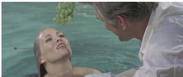
Foto 3: Gwen inspira amor y pasión

en su mente dos modelos de vida el de su progenitor deseoso de éxito y de dinero y el suyo, el de un escritor frustrado. Su padre fue un comerciante de alfombras venido a menos, autoritario y hosco con su familia, que le admira no por su trabajo sino por sus ingresos. Además, rememora el conflicto que tuvieron cuando deseó que siguiera con el negocio de las alfombras. Su padre no quiere pasar sus últimos días en la clínica y le ayuda a abandonarla y a llegar a la casa familiar. Eddie se reencuentra con su amante Gwen (foto 4) y le ruega que vuelvan a estar juntos cuando se entera que va a ser padre. Esto desata una nueva crisis familiar entre Eddie su mujer y su cuñada. Estas desean llevar a su padre a una residencia cosa que acaban consiguiendo. Eddie prende fuego a su casa como una catarsis de ira para romper con el modelo capitalista de su padre, y para romper, de manera simbólica, con un pasado que quiere dejar atrás.