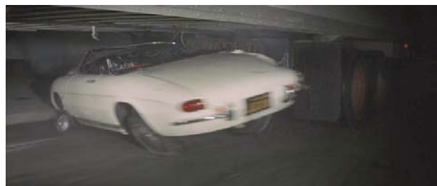
Foto 2: el protagonista intenta suicidarse estrellándose con un camión

Eddie sufre una segunda crisis cuando su padre ingresa en el hospital. Al visitarlo se enfrentan