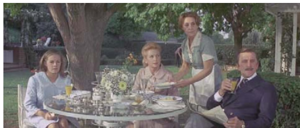
Foto 1: Eddie Anderson posee una casa imponente una mujer atractiva y guapa y una hija modélica

El compromiso narra la historia de Eddie Anderson (Kirk Douglas), un ejecutivo de publicidad de Los Ángeles, de mediana edad y origen griego (se llama realmente Evangelos Arness). Dispone de todas las comodidades y bienes que podrían hacer feliz a cualquiera: un trabajo exitoso, importantes ingresos, ha terminado una campaña de publicidad de una marca de tabaco, una casa imponente en un área residencial de las afueras de Los Ángeles, perfectamente equipada y con sirvientes, varios coches y entre ellos un deportivo descapotable, una mujer atractiva y guapa, Florence (Deborah Kerr), una hija modélica que ha terminado el instituto y que va a empezar la universidad (foto 1) e incluso un romance con una secretaria... Todo aparentemente es perfecto pero, hay algo que no encaja en el interior de su mente: un desencanto profundo y subterráneo por su acelerado ritmo de vida y un hastío por la forma en que vive. Una mañana aparentemente normal después de desayunar en el jardín de su mansión, mientras va de camino a la oficina en su descapotable, ante el repetición machacona en la radio del anuncio que ha realizado para la marca de tabaco “Zephir” sufre una crisis nerviosa e intenta suicidarse estrellándose con un camión (foto 2). Sobrevive levemente herido y aparentemente sin capacidad para hablar.