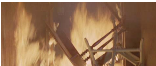
Foto 10: Eddie quema la casa de sus padres

El acto de quemar el chalet es un símbolo de “ruptura” con el pasado y de “renacimiento”, desde la nada. Este elemento simbólico también es usado en El compromiso cuando Eddie se refugia en casa de sus padres y quema los documentos mercantiles de la ruinosa empresa de alfombras de su progenitor, y el fuego posteriormente se extiende destruyendo la casa paterna donde vivió sus primeros años de vida Eddie. (foto 10). Es un rito de destrucción de una forma de vida que no desea continuar, un acto de rebeldía ante un padre que no le permitía desarrollar sus inquietudes artísticas como escritor, como una forma de romper con el pasado.