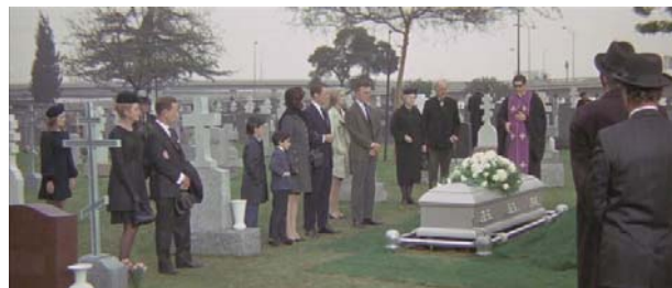
Foto 5: en la escena final todos los personajes se reúnen en torno al entierro del padre de Eddie

Las manifestaciones de Eddie se encuadran dentro de los trastornos adaptativos, en el subtipo de