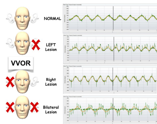
Figura 1. Los resultados de la prueba VVOR en controles, pacientes con hipofunción vestibular unilateral que afecta a los lados derecho e izquierdo, y pacientes con hipofunción vestibular bilateral.

En HVU, el HIMP muestra ganancia reducida del VOR seguida de sacádicos compensatorios cuando la cabeza es acelerada hacia el lado afectado. En cambio, el SHIMP demuestra sacádicos de refijación cuando la cabeza se acelera hacia el lado afectado [5,6,7].