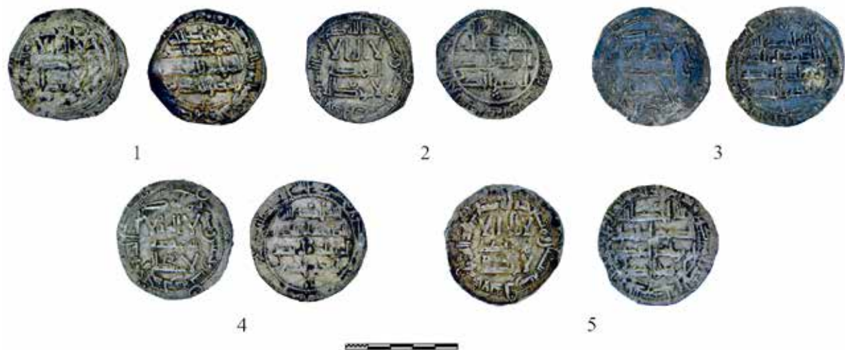
FIG. 9. Los dirhams de El Rebollar después de los trabajos de restauración del SECYR.

conjunto objeto del presente estudio, lo que eleva hasta nueve el total de tesoriillos de esta cronología (Figs. 8 y 9).