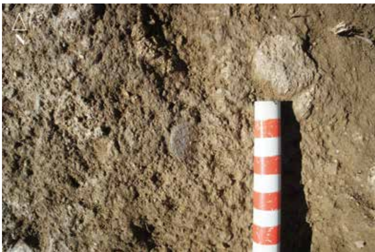
FIG. 6. Disposición de las dos monedas adheridas entre sí (n.º 1 y 2).

En la Moneda 2 (Vives 99; Frochoso 196.11) podemos observar una media luna o arquito invertido entre la segunda y la tercera línea de la leyenda central de anverso. Alrededor presenta gráfila exterior con círculos con punto interior que se intercalan entre las mismas. En el reverso se incluye un punto central sobre la leyenda central de reverso