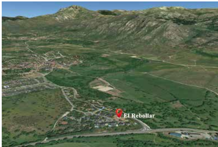
FIG. 2. Ubicación del yacimiento de El Rebollar en El Boalo (Madrid) y el centro del municipio (a partir de Google Maps).

Durante las décadas siguientes el yacimiento fue objeto de excavaciones clandestinas que afectaron a un buen número de sepulturas. La actuación arqueológica parcial de 1998, dirigida por Castro