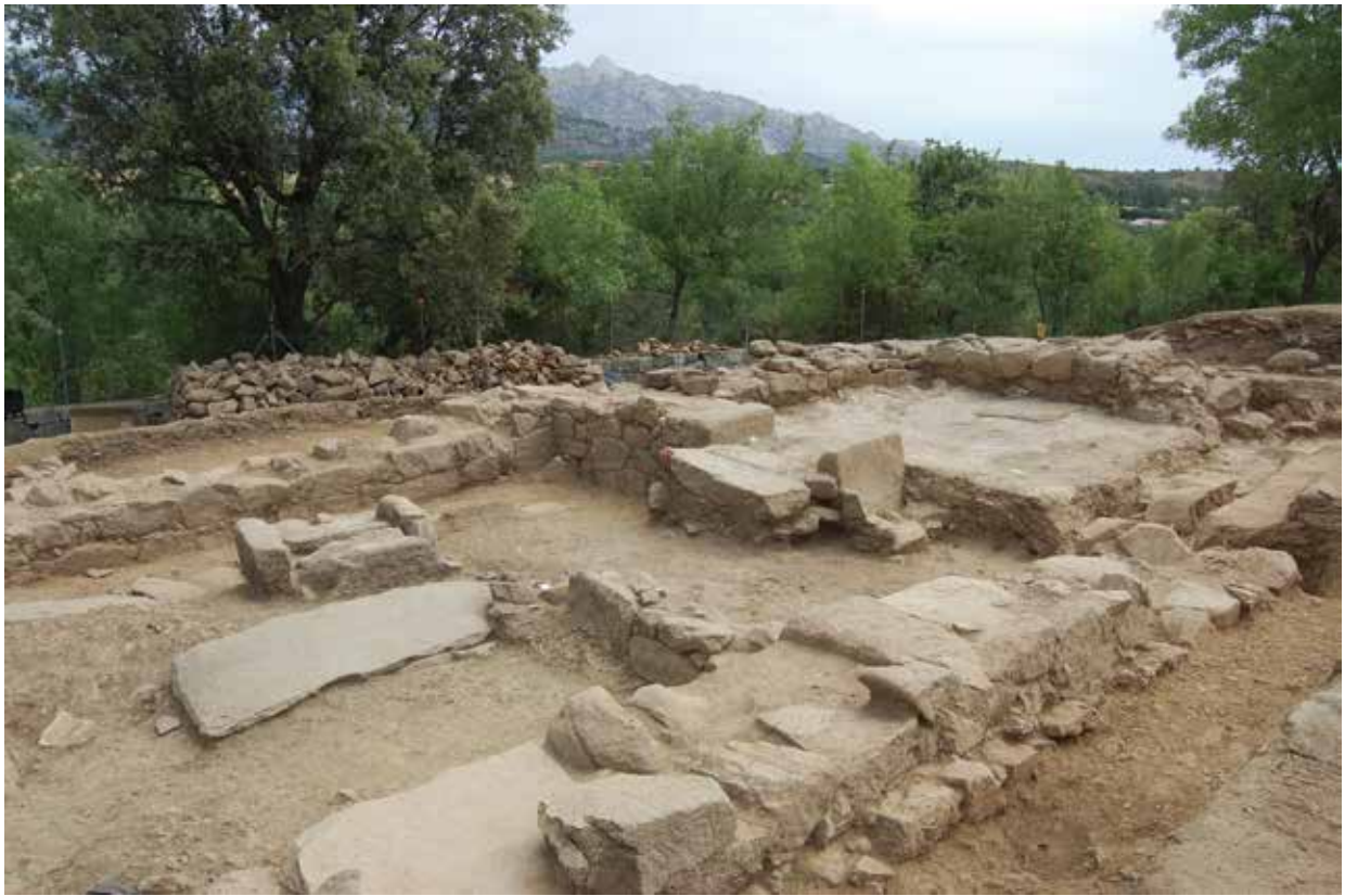
FIG. 3. Estado de conservación del yacimiento al finalizar la campaña de 2019.

a los pies del anterior. El primero está asociado a una botella –n.º inv. 2019/20/308–, de base ligeramente convexa, cuerpo cilíndrico, cuello estrecho, con dos asas de cinta de sección romboidal. De factura tosca, es asimétrica y presenta una altura de 27 cm. Este tipo cerámico correspondiente a la forma T.15.5, según la tipología de Gutiérrez Lloret (1996), se ha podido datar en contextos del centro peninsular del s. VI d. C. y, sobre todo, del VII d. C., como en la parcela R3 de la Vega Baja, en Toledo (Aranda, 2013: 393, figs. 7-9); en Camino de los Afligidos, Alcalá de Henares (Fernández Galiano, 1976, fig. 33; Méndez y Rascón, 1989: fig. 64, n.º 1); en el Cerro de las Losas en El Espartal, Madrid (Alonso, 1976: fig. 13), y en Castiltierra, Segovia (Camps, 1984: fig. 73). Este tipo de recipientes se han fechado también en contextos en los ss. VI-VII d. C. en Pla de Nadal, Valencia (Juan y Centelles, 1985), en La Alcudia de Elche (Gisbert, 1986: figs.