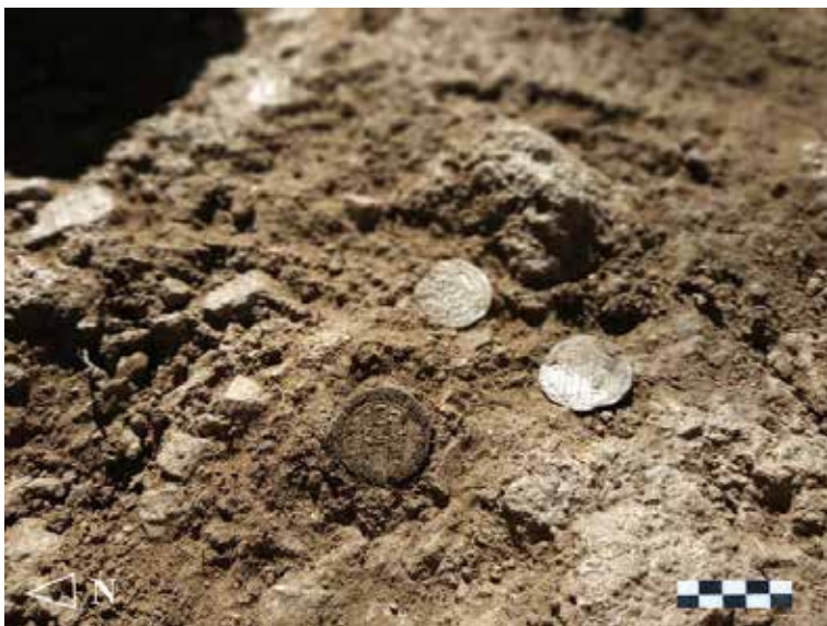
FIG. 7. Posición in situ de los numismas en la UE 2011.

y entre la segunda y la tercera línea, así como tres puntos formando un triángulo por debajo de la leyenda central.