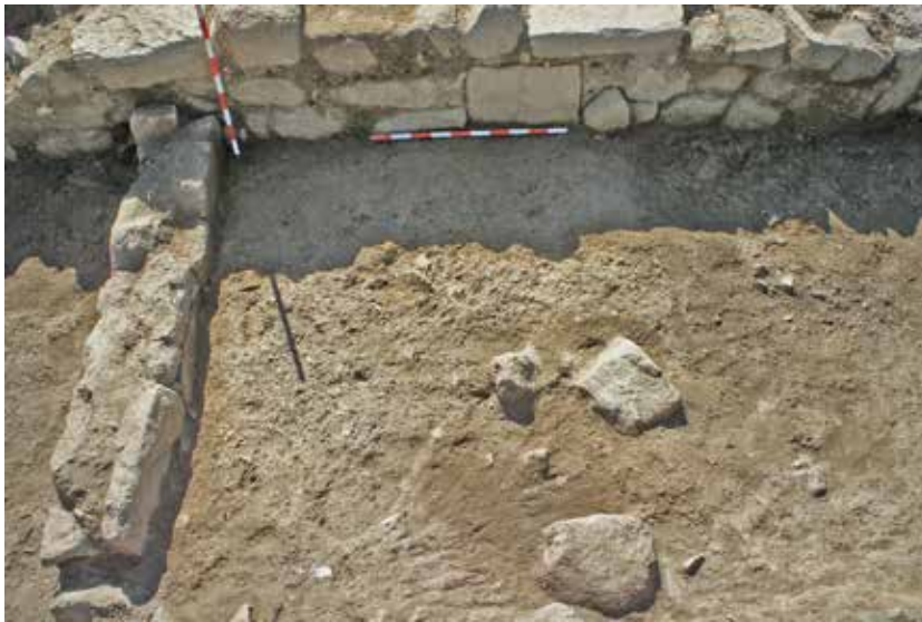
FIG. 5. Nave de la iglesia tardoantigua = UE 2011.

vertical y dos perfectamente adheridas podrían ser indicios de que pudieron contenerse en un saquito, pero no tenemos más argumentos para defender esta hipótesis.