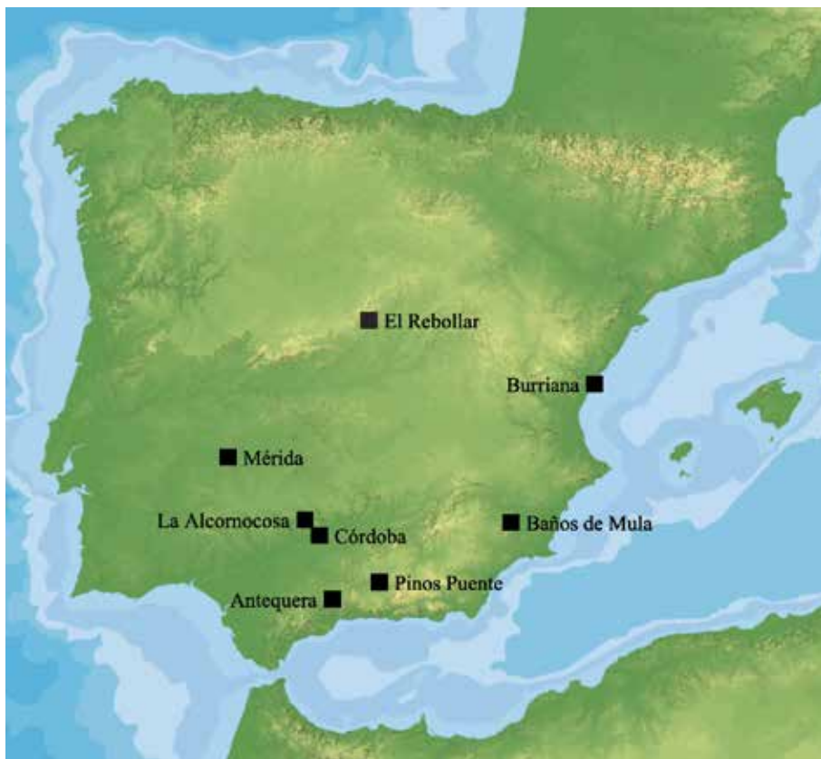
FIG. 10. Mapa de distribución de los hallazgos de la primera época que presentan fechas de cierre en el periodo de al-Hakam I (180-206 H./796-822 d. C.).

En el hallazgo de Burriana, Castellón, como ya hemos comentado, del total de monedas recuperadas solo ocho pudieron ser estudiadas, por lo que los datos deben ser tomados con cautela al no conservarse una muestra suficientemente representativa. Las fechas de los dirhams que han sido estudiados se encuadran entre 153 H./770 d. C. y 201 H./816-817 d. C., momento este último al que corresponde el 50% de los ejemplares (Doménech, 2003: 118-120).