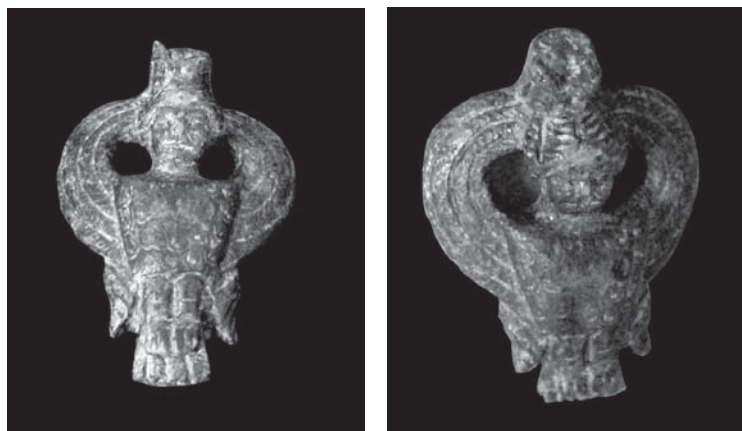
FIG. 1. Aplique de bronce de Layana (Zaragoza) tras su limpieza y restauración: detalles del anverso de la pieza.

La pieza, afectada en el momento de su hallazgo por concreciones terrosas y homogéneas de carbonatos que cubrían casi la totalidad de la misma, fue sometida a un proceso de limpieza y restauración por medios mecánicos y químicos y, posteriormente, desalada, para garantizar su mejor conservación y estudio 2 . De la misma, en el contexto del yacimiento en que fue recuperada –seguramente una pequeña finca suburbana del territorium del municipium latino, aún de nombre ignoto, de Los Bañales (Andreu et al. , 2009: 150-151)– y del estudio del resto de materiales recuperados en dicha campaña de prospecciones en el lugar se dio una breve noticia en el trabajo de publicación de los resultados de la campaña en cuestión 3 . El objetivo de estas páginas es proceder a un monográfico estudio de este objeto ya que la investigación llevada a cabo permite afirmar que –con la bibliografía disponible y sin perjuicio de que existan otros ejemplares semejantes inéditos, rémora habitual en el estudio en nuestro país de este tipo de piezas (Aurrecoechea