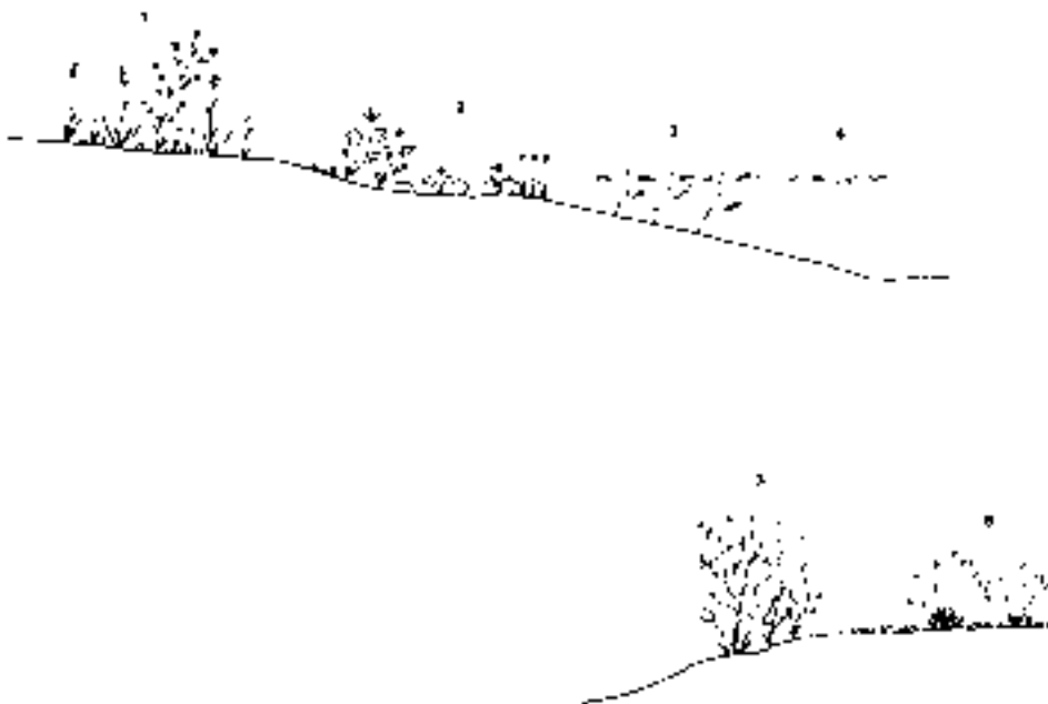
FIG. 4. Vegetación edafohigrófila: 1. Vallicares sobre suelos semiinundados ( Pulicario uliginosae-Agrostietum salmanticae ); 2. Formación anfibia de eringio corniculado ( Eryngio corniculati-Preslietum cervinae ); 3. Comunidad acuática enraizada ( Myriophyllo alterniflorae-Potametum crispí ); 4. Comunidad acuática flotante ( Lemno minoris-Azolletum caroliniana ); 5. Comunidad higrófila del nabo del diablo ( Glyceria declinatae-Oenanthe-tum croccatae ); 6. Trebolares con junco churrero ( Trifolio resupinati-Holoschoenetum ).

Allí donde el agua permanece hasta el estío se presenta otra comunidad en la que aparecen Eryngium corniculatum Lam., Eleocharis palustris (L.) Roemer & Schultes, Glyceria declinata Bréb. y Antinoria agrostidea (DC.) Parl. Se trata de la asociación Eryngio corniculati-Preslietum cervinae Rivas Goday 1957, endémica de las provincias occidentales ibéricas (RIVAS GODAY, 1970: 250), con fenología prima-