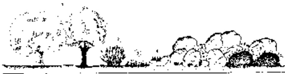
FIG. 2. Vegetación potencial y comunidades seriales en Los Barruecos: 1. Encinar con alcornoques ( Pyro bourgaeanae-Quercetum rotundifoliae faciación granítica con Quercus suber ); 2. Escobonal de escoba blanca ( Cytisus multiflori-Retametum ); 3. Pastos terofíticos ( Trifolium cherleri-Plantaginetum bellardii ); 4. Comunidades pioneras ( Sedetum caespitoso-arenarii ); 5. Espinales ( Rubo ulmifolii-Rosetum corymbiferae ).