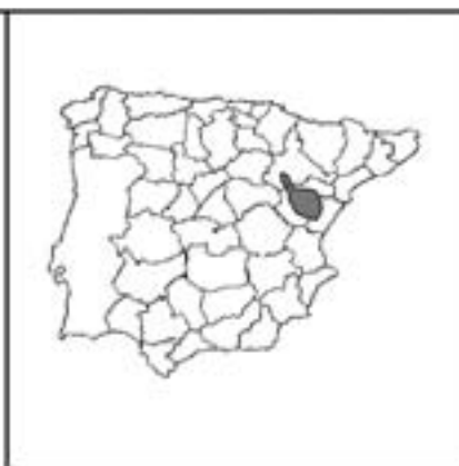
FIGURA 2. Mapa de distribución.