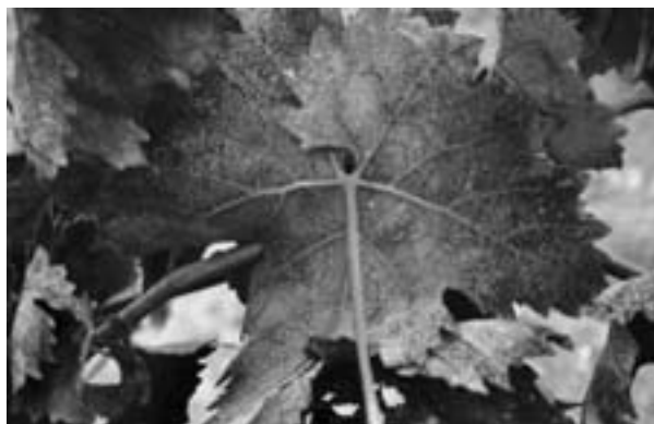
FIGURA 1. Vitis vinifera L. subsp. vinifera .

de ambos, y con el margen rojizo; la nerviación es palmeada y rojiza, rematando cada una de las venas principales en un lóbulo; el haz es glabrescente y el envés generalmente tomentoso, sobre todo a nivel de los nervios principales; la reticulación del envés es más pequeña que la del haz. El pecíolo es estriado, con tricomas tectores (Fig. 2).