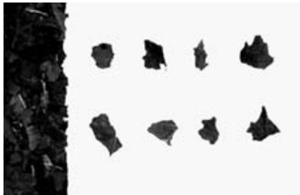
FIGURA 2. Trociscos de la hoja.

El fruto es carnoso, con el epicarpo delgado y pruinoso, el mesocarpo y el endocarpo son carnosos y jugosos.