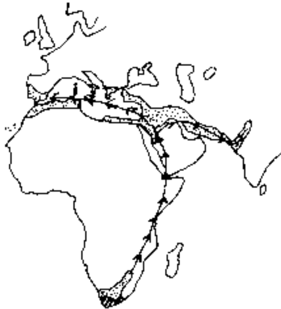
FIGURA. 1. Área del género Gynandriris Parl. En rayado plantas diploides; en punteado plantas poliploides. Las flechas indican la posible vía migratoria desde Sudáfrica.

El género Gynandriris Parl., Nuovi Gen. Sp. Monocot. 49 (1854), pertenece a la tribu Homeriinae ( Iridoideae , Iridaceae ) (DAHLGREN et al., 1985) con clara afinidad al género africano Moraea Miller, particularmente de la sección Polyanthes (GOLDBLATT & ANDERSON, 1986). De las nueve especies descritas, siete viven en el sur de África y sólo dos al norte del ecuador desde Portugal, Región Mediterránea, norte de Arabia al suroeste de Asia hasta el valle del Indo (GOLDBLATT, 1980; NASIR & RAFIQ, 1999). Las plantas africanas se encuentran principalmente en la región de El Cabo con clima tipo mediterráneo de inviernos lluviosos y veranos secos (GOLDBLATT, l.c.). La disyunción de ambas áreas es considerable; la distancia mínima entre ellas es de unos 5.200 km, G. simulans (Baker) Foster, en el sur de Zimbabwe y G. sisyrinchium (L.) Parl., en las proximidades de Medina en la península arábiga (Figura 1). Todas tienen número cromosómico básico x = 6 . Las plantas surafricanas son diploides ( 2n = 12 ) a excepción de G. simulans tetraploide ( 2n = 24 ) en sus poblaciones más orientales y hexaploide ( 2n = 36 ) en las que viven en la frontera con Namibia. Las plantas del Hemisferio Norte son tetraploides, ocupando la mayor parte del área G. sisyrinchium y en algunas localidades del Mediterráneo oriental G. monophylla Boiss & Heldr. (GOLDBLATT, l. c. ).