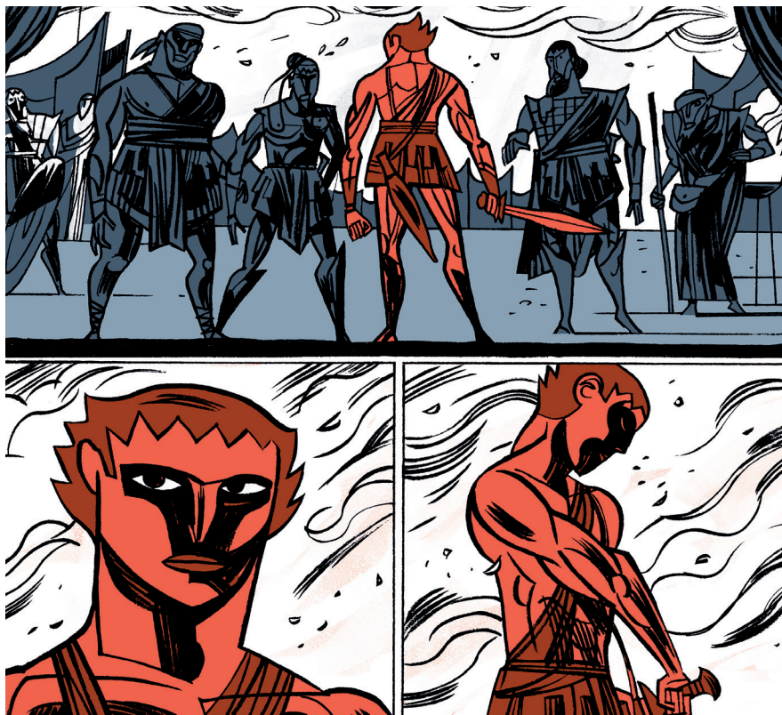
Figura 2. La cólera (© Javier Olivares y Santiago García). Astiberri, 2020, p. 79.