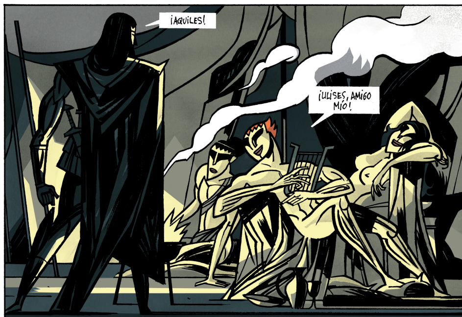
Figura 3. La cólera (© Javier Olivares y Santiago García). Astiberri, 2020, p. 36.

En estos ejemplos mitológicos, además, la exposición a la feminización de ambos personajes desemboca en un reforzamiento de su masculinidad, en una hipermasculinización, si se quiere 28 .