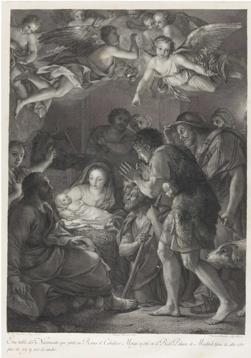
Figura 5. Raffaello Morghen, La Adoración de los pastores , según dibujo de José Beratón sobre el original de Anton Raphael Mengs, h. 1791, R2724, talla dulce, aguafuerte y buril sobre plancha de cobre, 615 x 414 mm, Calcografía Nacional, Real Academia de Bellas Artes de San Fernando, Madrid.