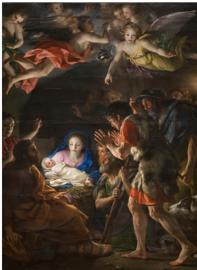
Figura 4. Anton Raphael Mengs, Adoración de los pastores , 1770, P2204, óleo sobre tabla de roble, 256 x 190 cm, Museo Nacional del Prado, Madrid.

Más problemas plantean tanto «la cabeza de nuestro redemptor Jesu christo [...]» como los dos cuadros enmarcados con cristales, pues, por el momento, no es posible relacionarlos con obra alguna de José Beratón.