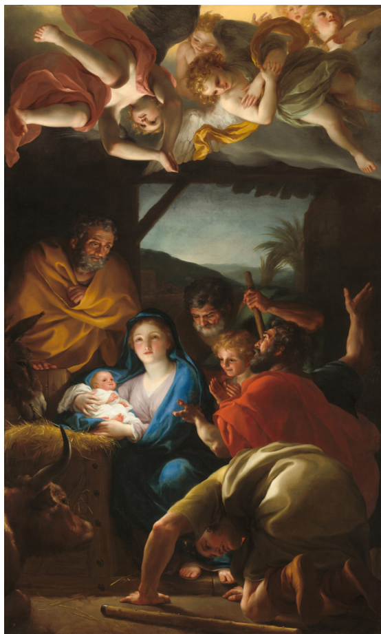
Figura 3. Anton Raphael Mengs, Adoración de los pastores , 1764/1765, n.º 2014.136.114, óleo sobre lienzo, 264,2 x 152,4 cm, Cocoran Gallery of Art, Washington.