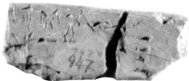
b. D 747 (échelle 1:1)