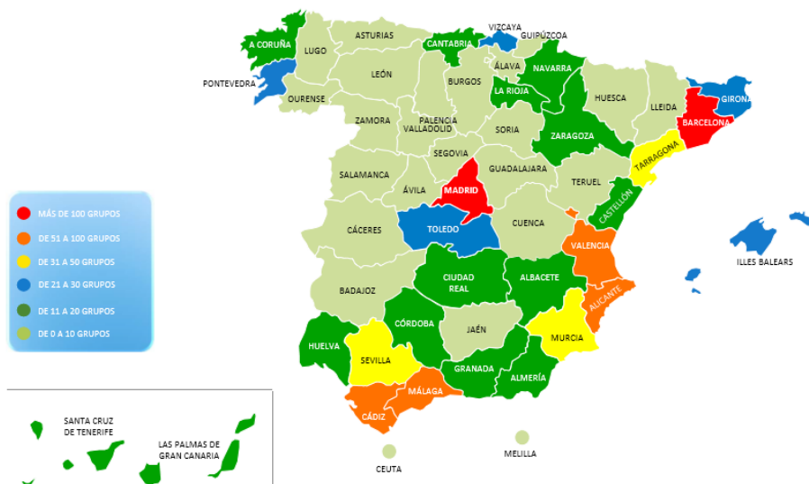
Gráfico 1. Situación del crimen organizado en España (2016)