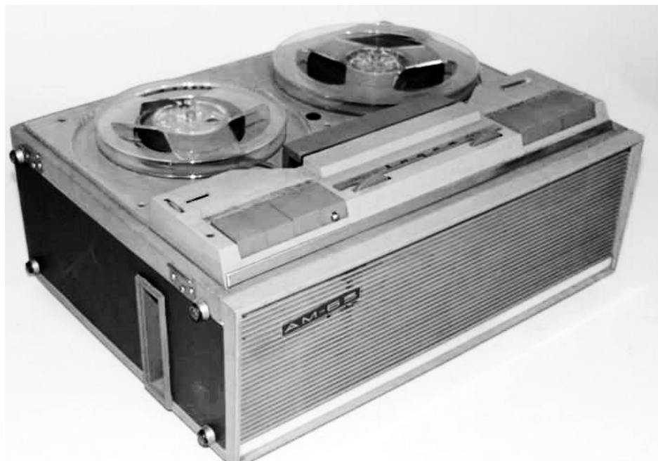
Foto n.º 1: Modelo de primer magnetofón que utilizó Carmelo en su trabajo de campo.

por falta de previsión. Era plenamente consciente de que para hacerlo funcionar necesitaba conectarlo a una red eléctrica pues era un aparato de válvulas, anterior a la aparición y generalización de los transistores que permitieron la primera miniaturización y el funcionamiento con baterías. Conocía el hecho de que todavía quedaban muchas zonas con una electrificación precaria o casi inexistente en el interior rural de aquella región en la que iba a trabajar, pero decidió seguir adelante y llevar consigo aquel magnetofón.