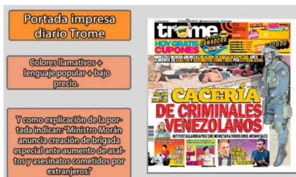
Imagen 1. Análisis de la portada del diario Trome 1 .

A continuación, en el gráfico N.º 1, se presenta la descripción de la portada del citado diario: