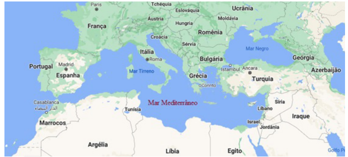
Mapa 1. Países banhados pelo Mar Mediterrâneo.

Cientificamente, as descobertas arqueológicas de sementes de uva e pó de videiras em ânforas datadas de 6 mil anos atrás, encontradas em uma escavação na Geórgia em 2016, país que se encontra ao norte da Turquia, permitem situar a origem do vinho naquele espaço geográfico, reconhecendo-o como o berço da produção de vinho, por volta do ano 8000 a.C, que está associado à sedentarização humana no Neolítico Antigo (McGovern et al. , 2017).