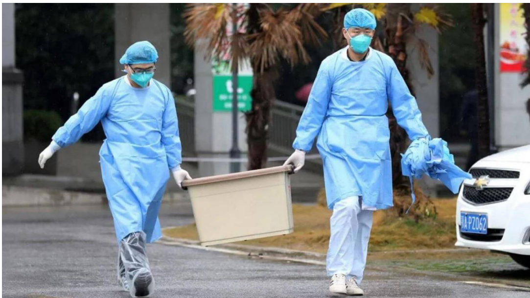
6.1 Uso de tapabocas, guantes y trajes aislantes.