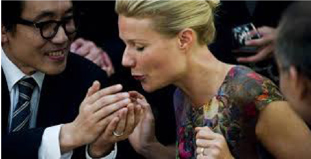
3. Formas de transmisión: el contacto con persona infectada o con superficies tocadas por personas infectadas.