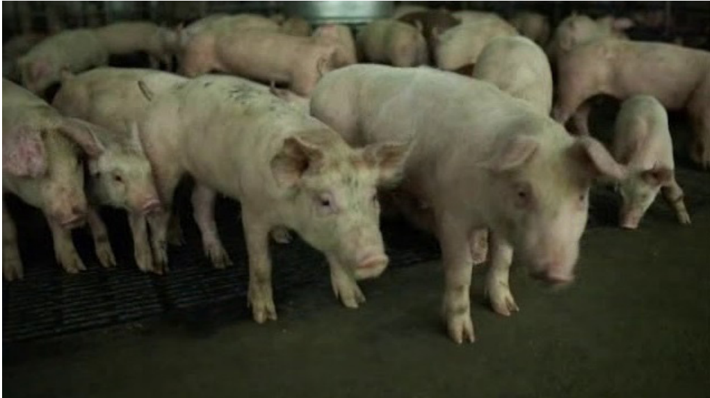
2. Fuente de Origen: Zoonosis. Hospedador definitivo.