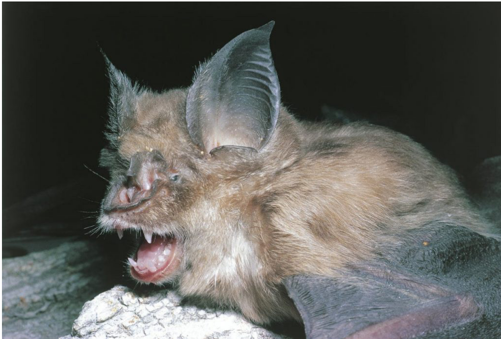
2.1 Hospedador intermedio.