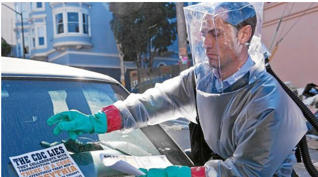
7. Reacciones: difusión de información falsa o desinformación.