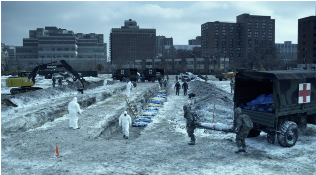
6.2 Cremación de cadáveres.