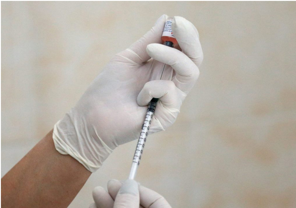
8. Tratamiento: la vacuna.