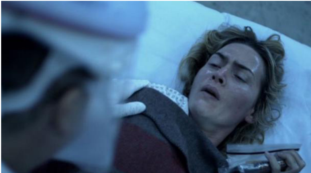
5. Manifestaciones clínicas: fiebre, dolor de garganta, tos, sudoración, malestar general.