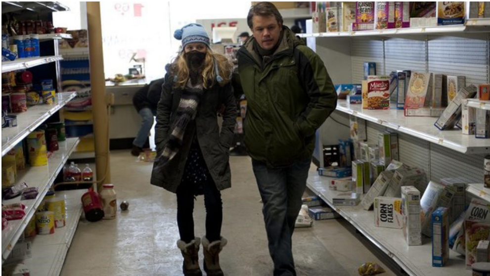
7.2. Pánico: compras sin sentido.