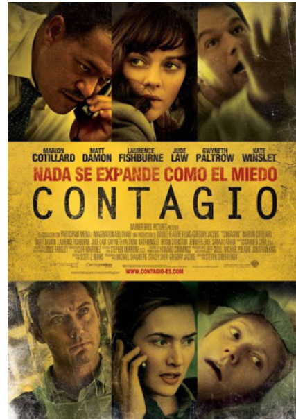
Cartel español Acción: alrededor de 2010 (Hong Kong, Chicago, Atlanta, Minneapolis).