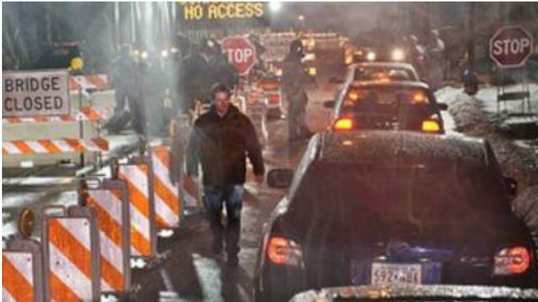
6. Medidas de contención: cuarentena y cierre de fronteras.