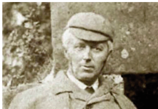
Foto 2. Joseph Bell con vestimenta de Holme.

Arthur Conan Doyle lo conoció en 1877 y se desempeñó con él en la Real Enfermería de Edimburgo (Hospital-escuela). Según Doyle, basó libremente a Sherlock Holmes a en el método de observación-deducción b y la particular vestimenta de Bell (Foto 2).