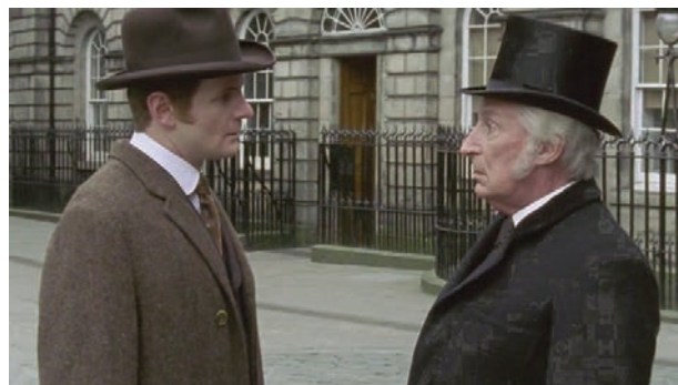
Foto 4. El Dr. Joseph Bell (Ian Richardson) y Arthur Conan Doyle (Charles Edwards).

Episodio 2: [ Los ojos del paciente (Los Misterios del Auténtico Sherlock Holmes) / The Patient's Eyes (Murder Rooms: Mysteries of the Real