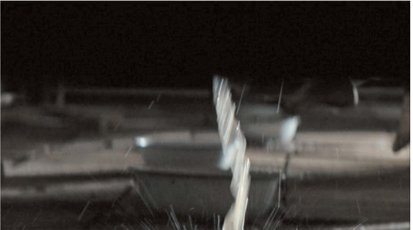
Cuadro clínico: deposiciones acuosas