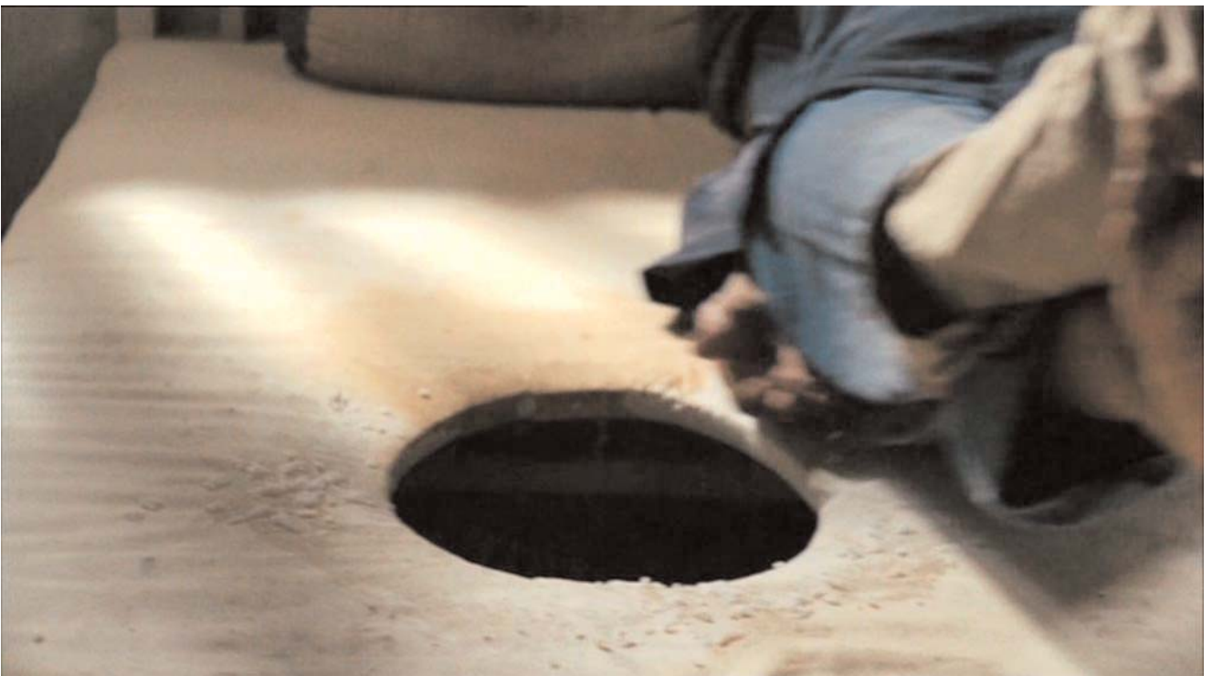
Cuadro clínico: diarrea