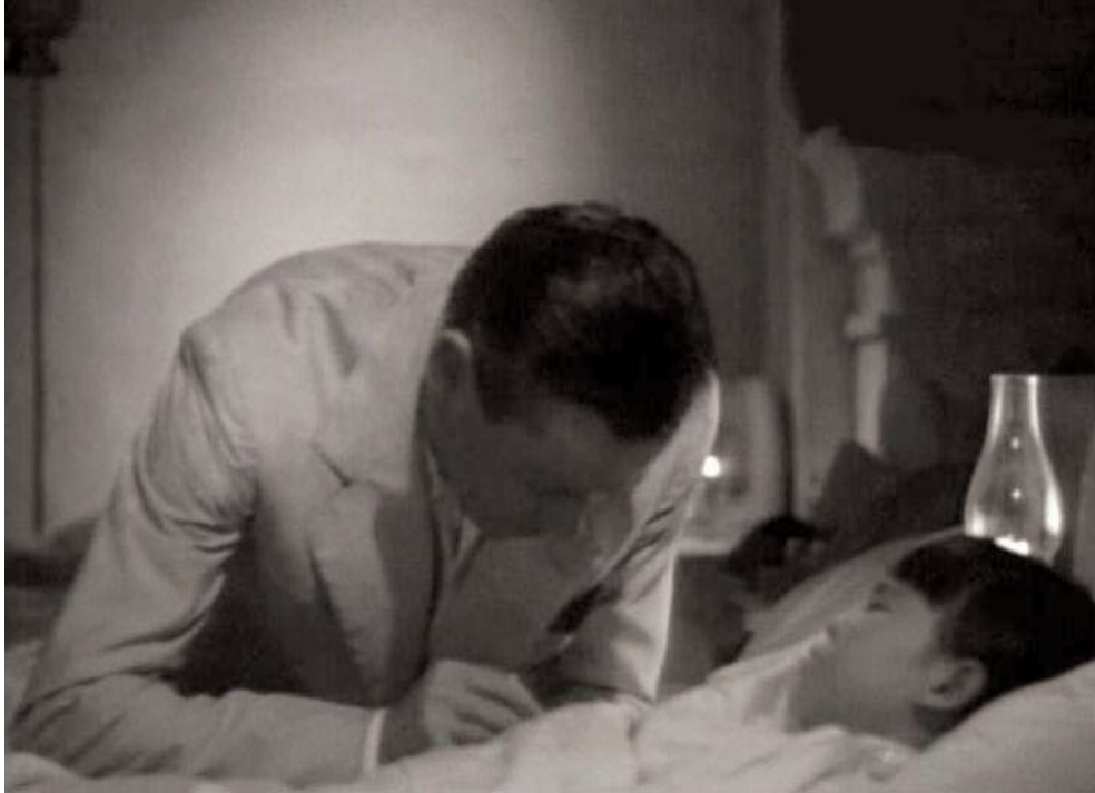
Historia del tratamiento anticolérico: cafeína hipodérmica