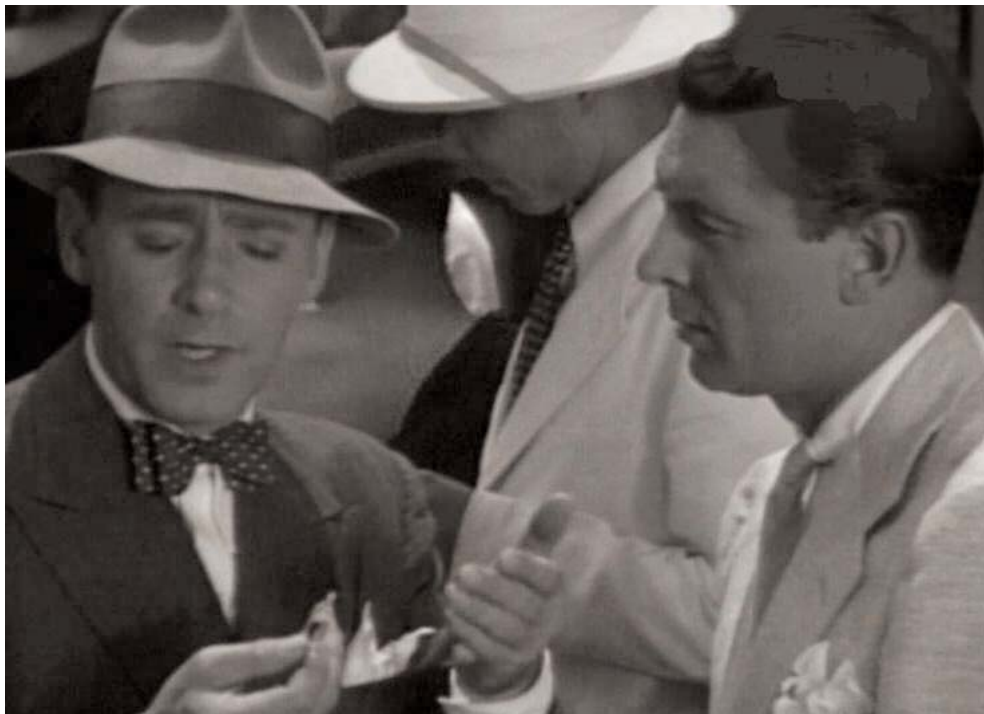
Prevención: vacuna anticolérica con gérmenes muertos