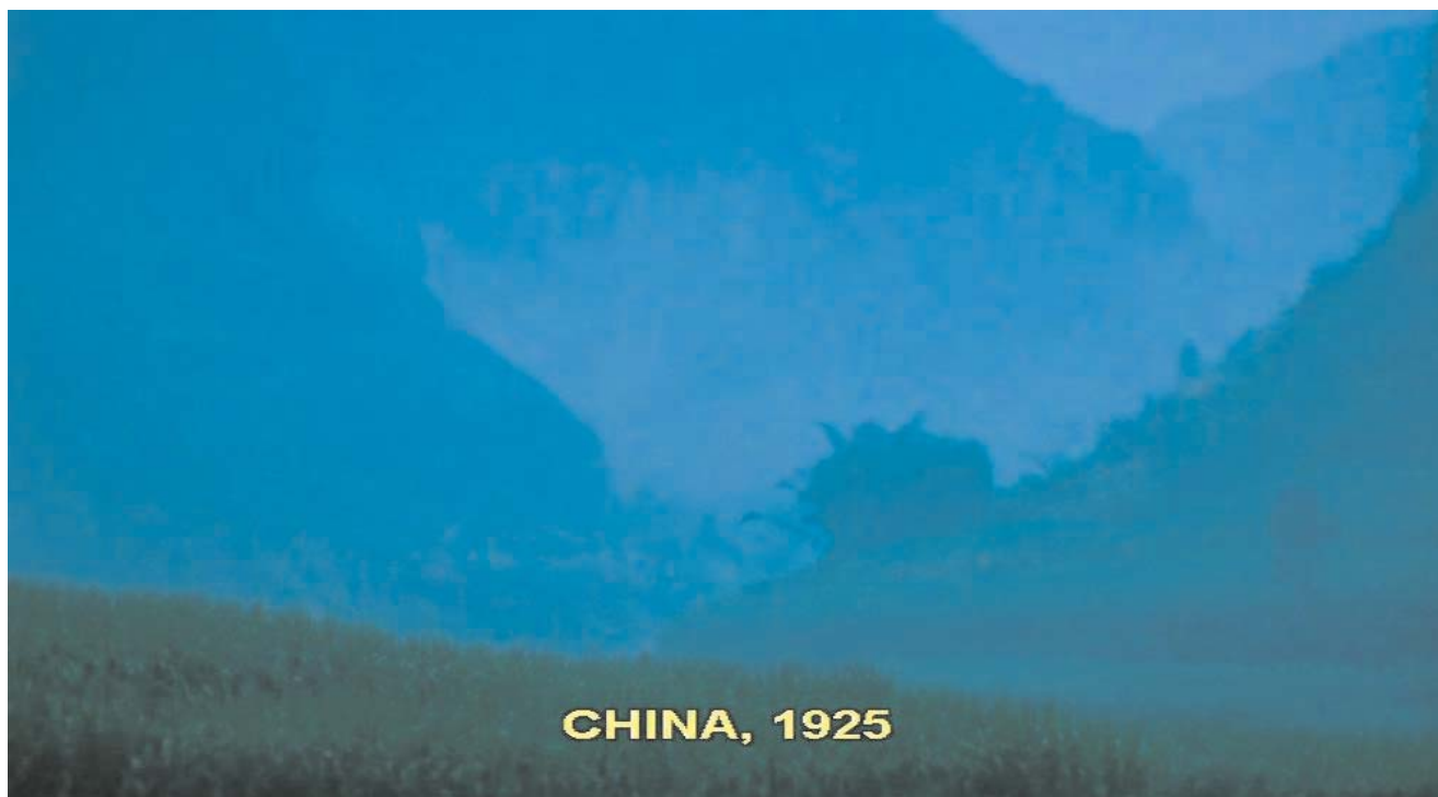
Primera pandemia de cólera (1816-1826)

Productoras: WIP, Stratus Film Co., Bob Yari Productions, Class 5 Films, The Colleton Company, Dragon Studios, Emotion Pictures, The Mark Gordon Company y Warner China Film HG Corporation.