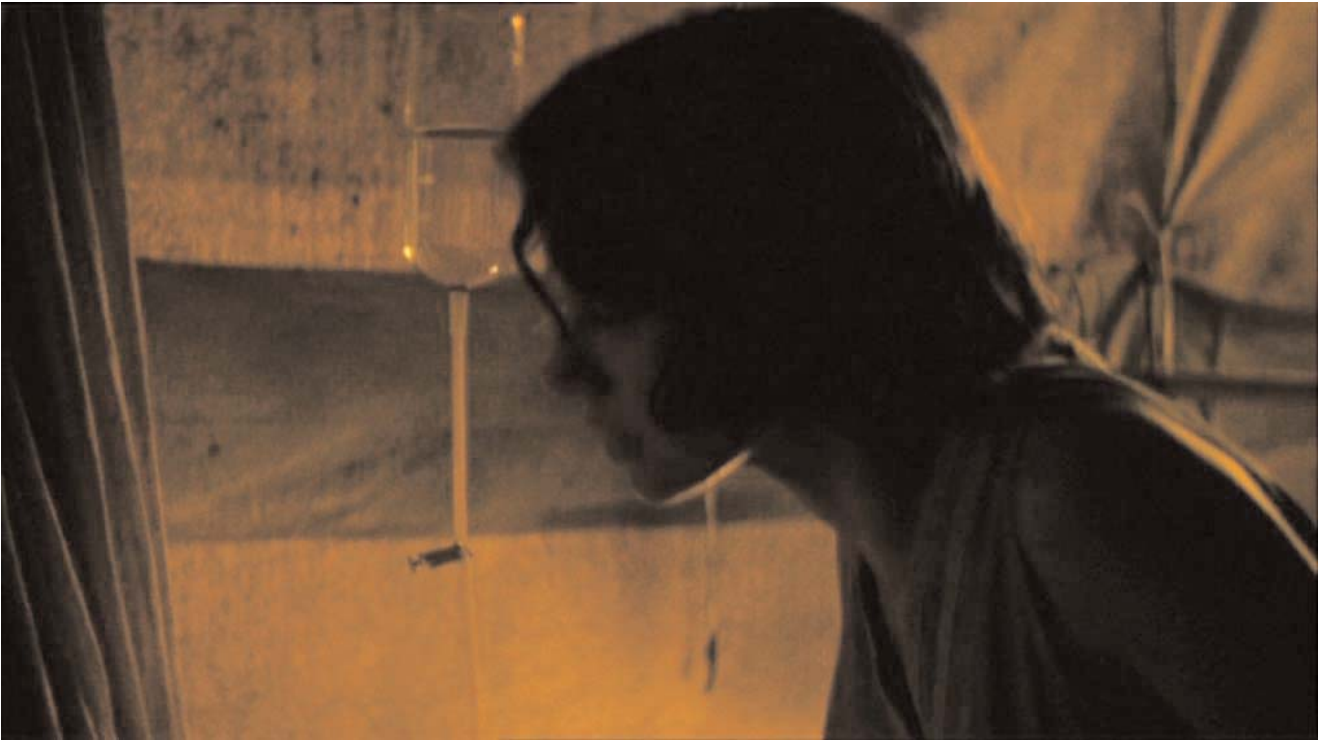
Tratamiento: rehidratación (agua y electrolitos)