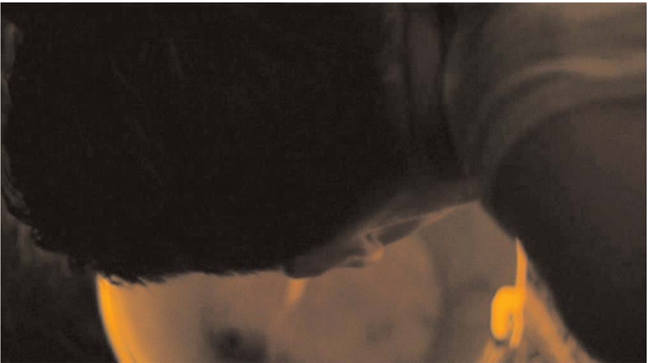
Cuadro clínico: vómitos