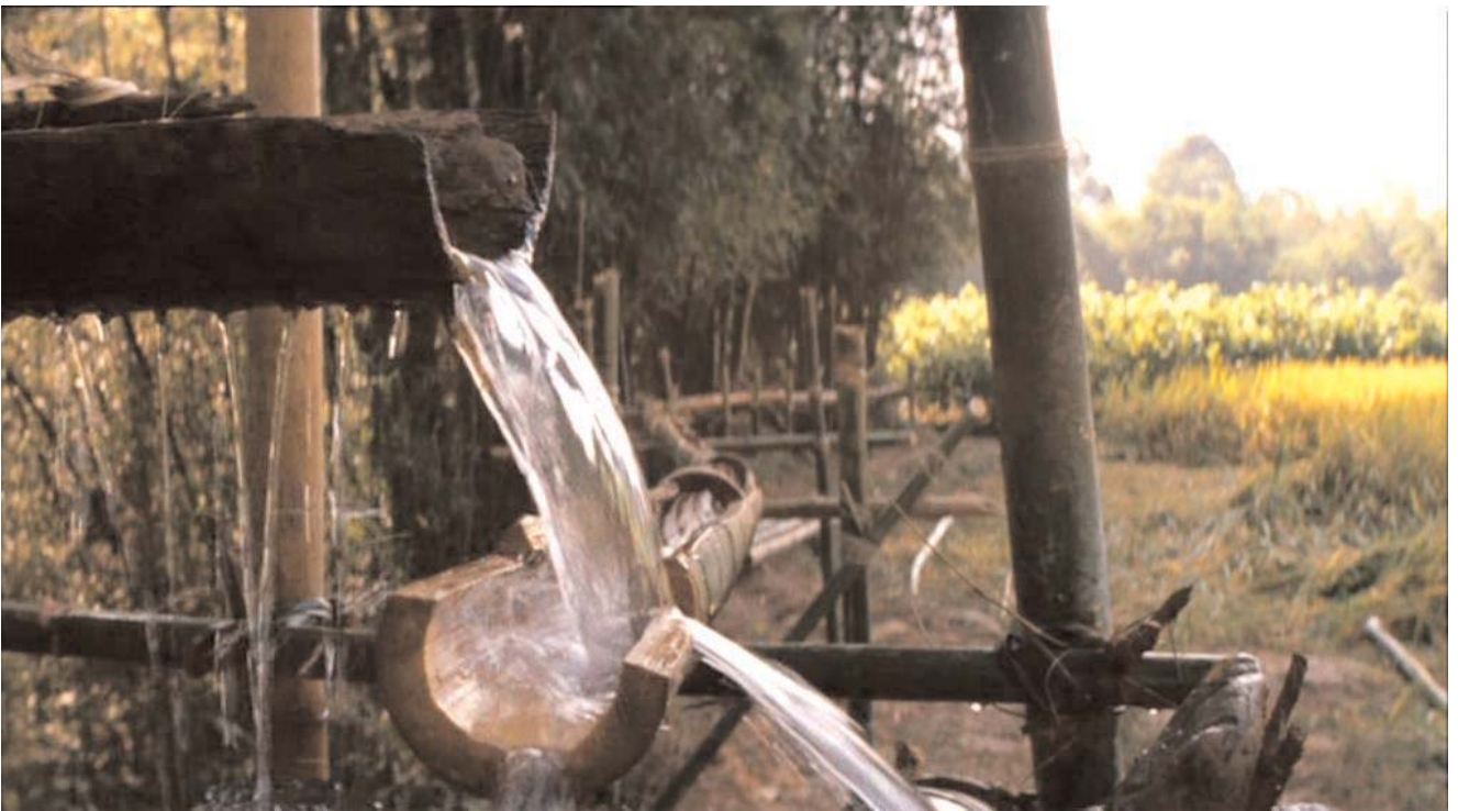
Prevención: suministro adecuado de agua