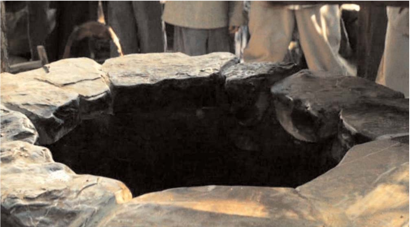
Epidemiología: origen hídrico