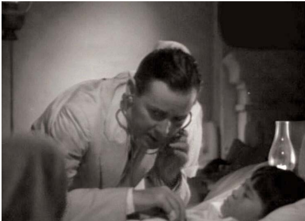
Cuadro clínico: alteraciones hemodinámicas