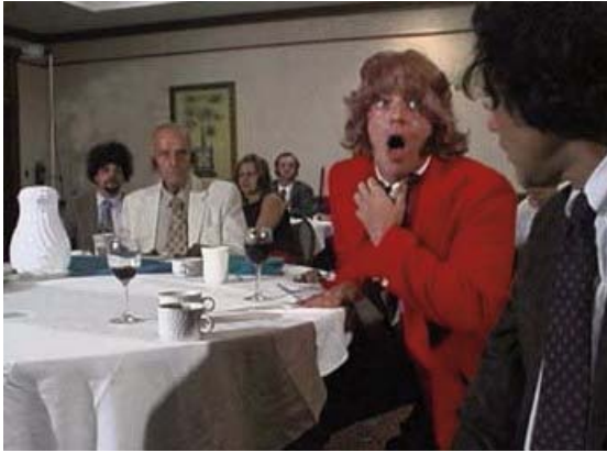
Foto 22: el atragantado se lleva las manos al cuello en The History of Choking