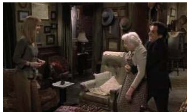
Foto 15: Alex levanta del sillón a la señorita Connelly y le realiza la maniobra de Heimlich en Duplex