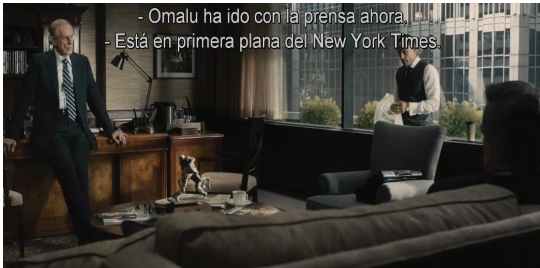
Fotograma 5. El film representa la dimensión política del hallazgo clínico del Dr. Omalu