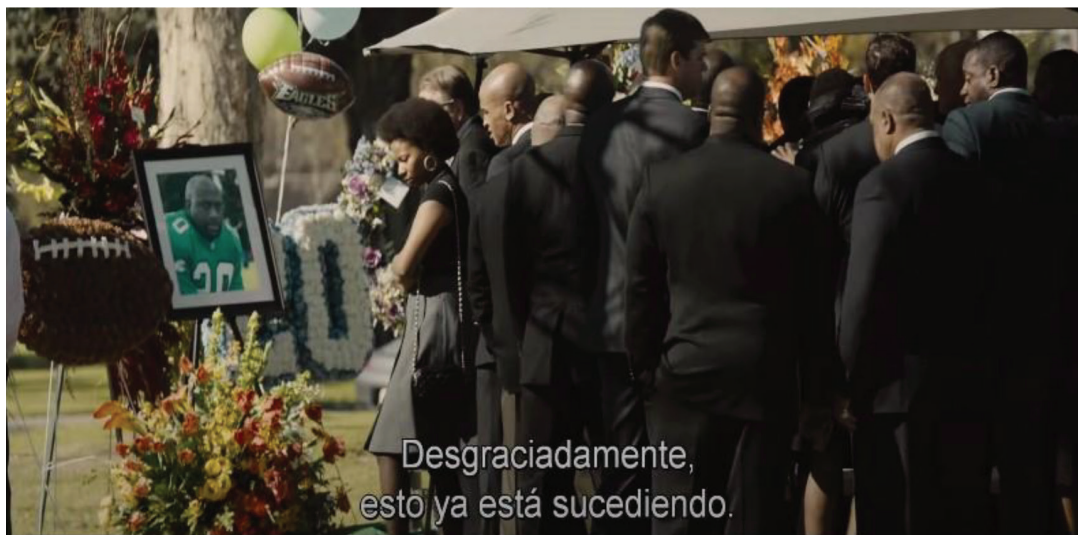
Fotograma 4. El film representa la presencia del fenómeno de interés del Dr. Omalu