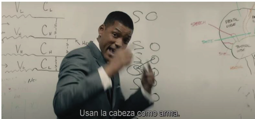
Fotograma 3. El Dr. Omalu explicando los procesos etiopatológicos de la demencia de exjugadores de fútbol americano