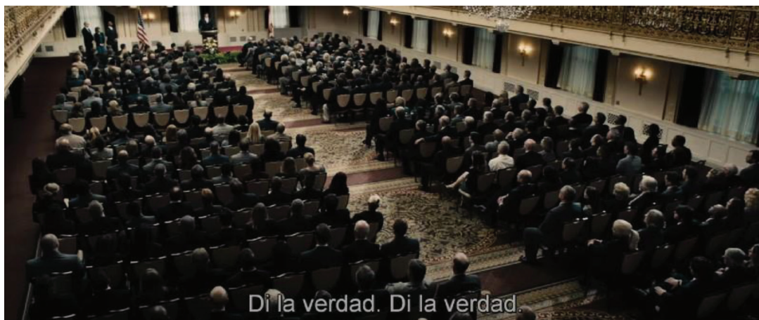
Fotograma 7. El film representa, finalmente, la justicia en torno Dr. Omalu