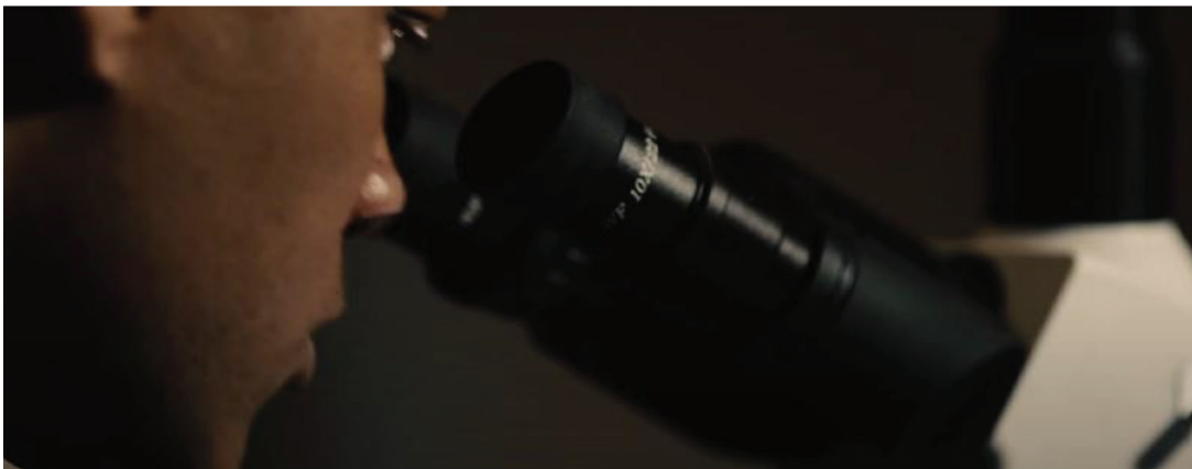
Fotograma 2. El Dr. Omalu realiza la necropsia microscópica a un exjugador de futbol americano