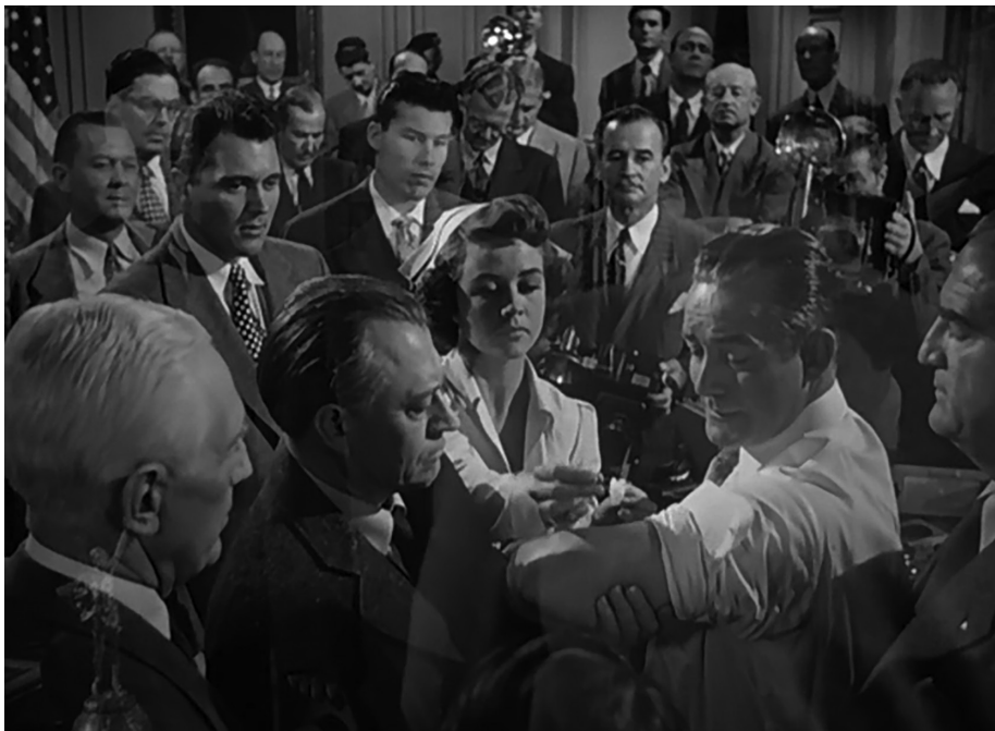
Fotograma 14. Vacunación por escarificación