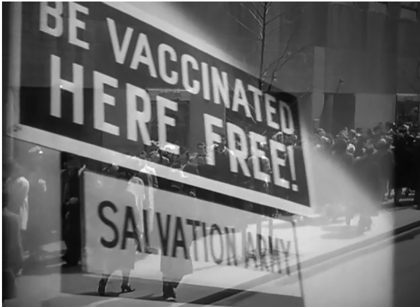
Fotograma 13. Prevención: vacuna