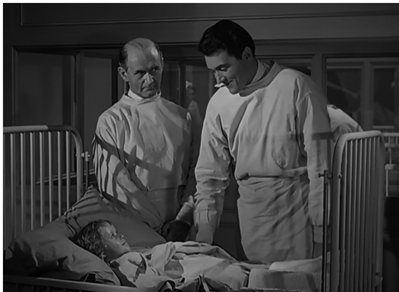
Fotograma 7. Tras el periodo de incubación la pequeña presenta cefalea, dolor de espalda, fiebre y exantema