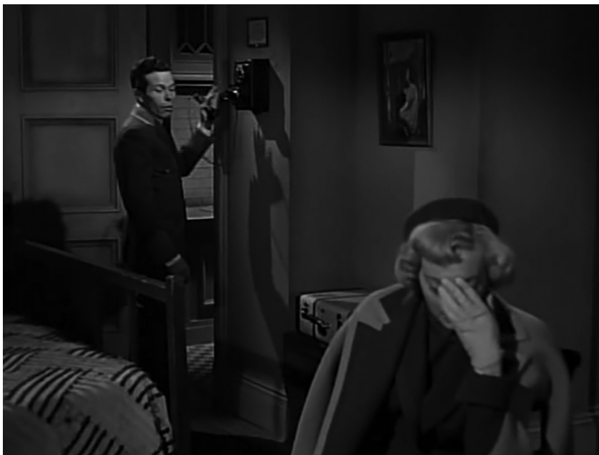
Fotograma 2. Dolor de cabeza