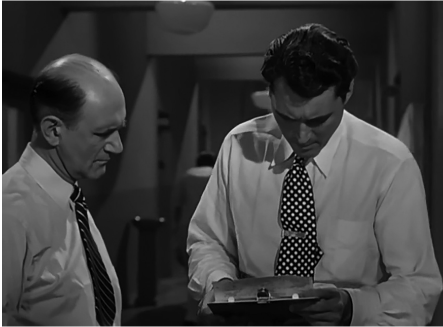
Fotograma 9. La niña nunca había sido vacunada