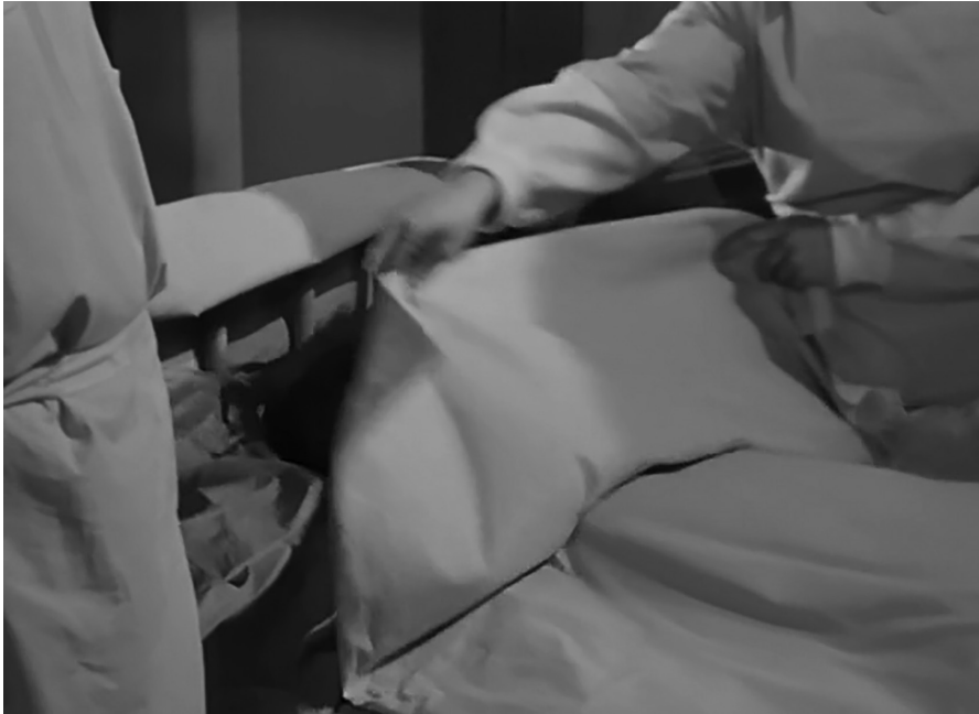
Fotograma 11. La viruela es una enfermedad infecciosa que produce una elevada mortalidad