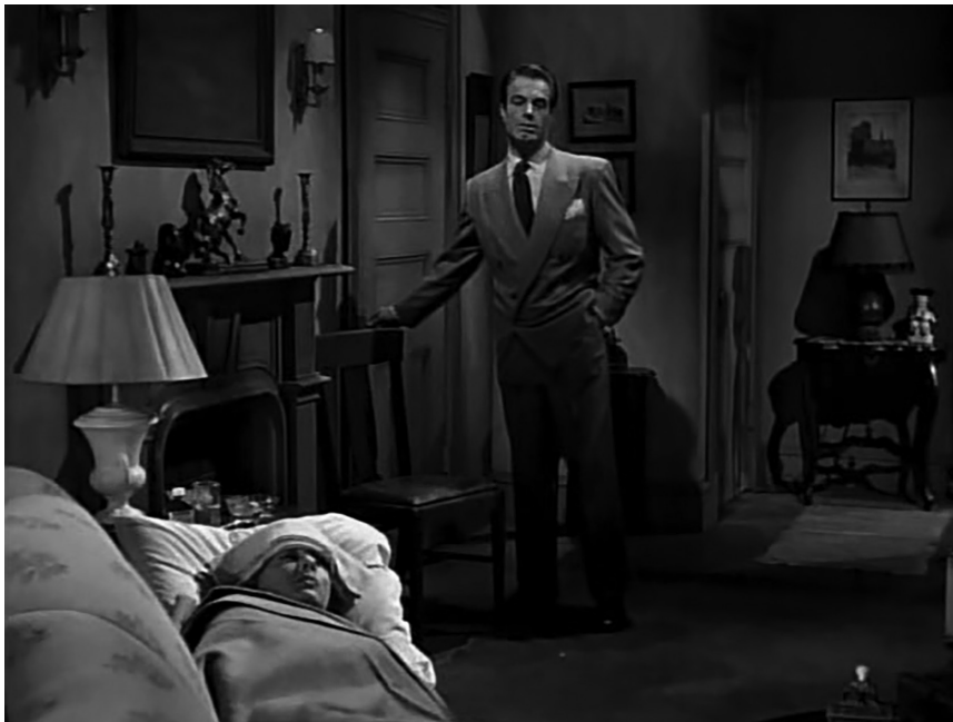
Fotograma 4. Fiebre y postración