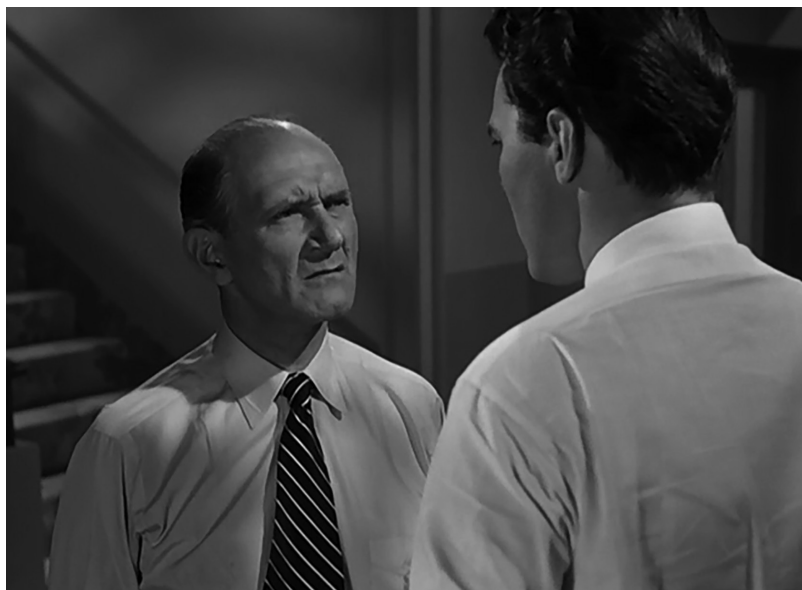
Fotograma 8. Recordando las enfermedades de la Edad Media esos síntomas se corresponden con los de la viruela