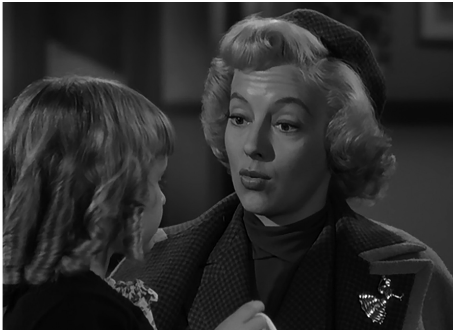
Fotograma 6. Trasmisión por contacto directo por vía aérea. Relación estrecha y prolongada entre la mujer y una niña