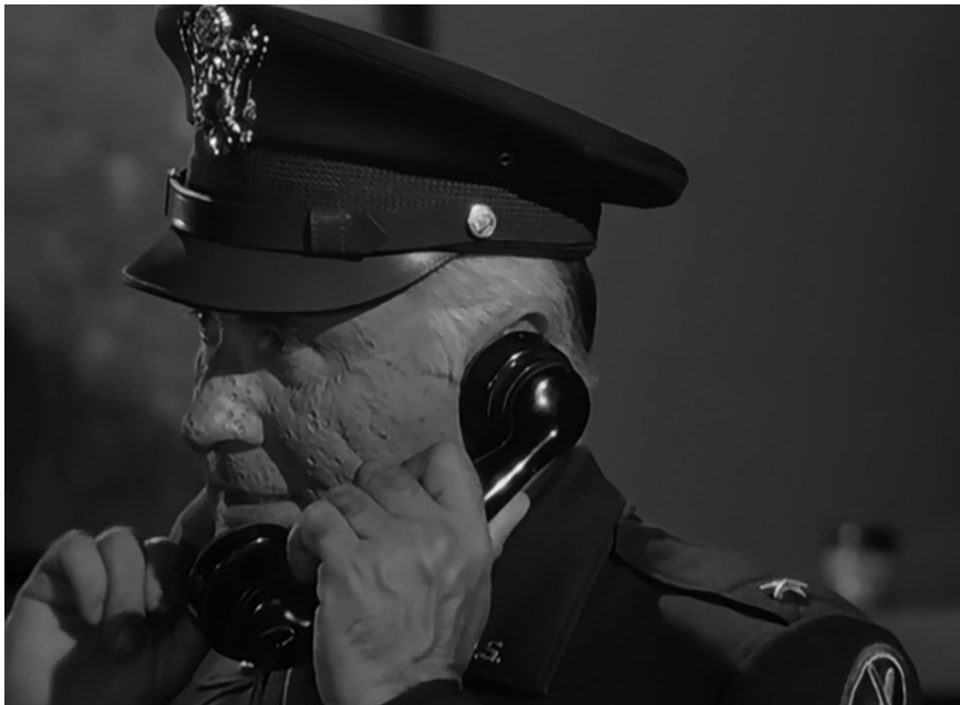
Fotograma 12. A los supervivientes le pueden quedar cicatrice (Cara picada de viruelas)