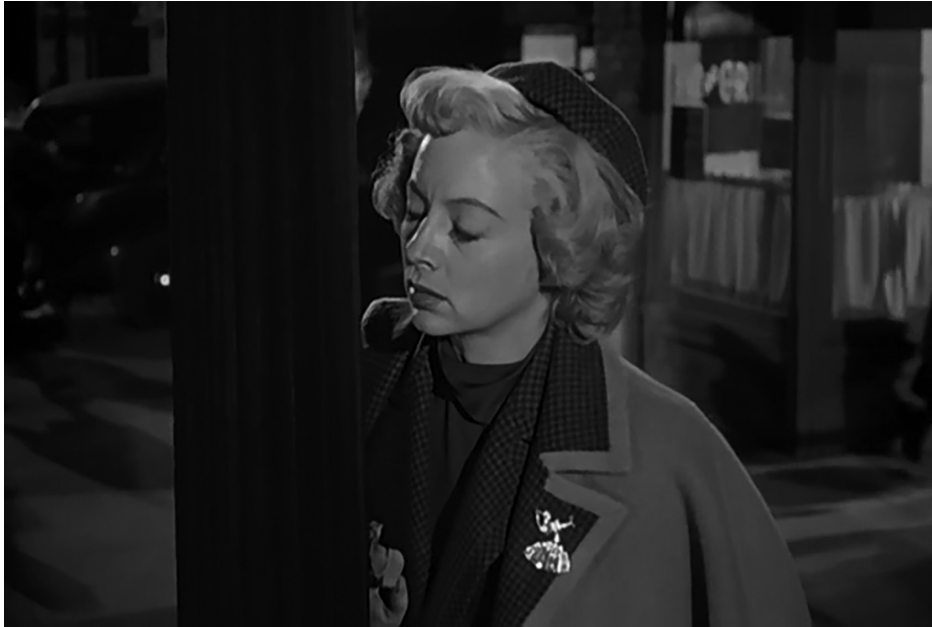
Fotograma 3. Malestar general y fatiga