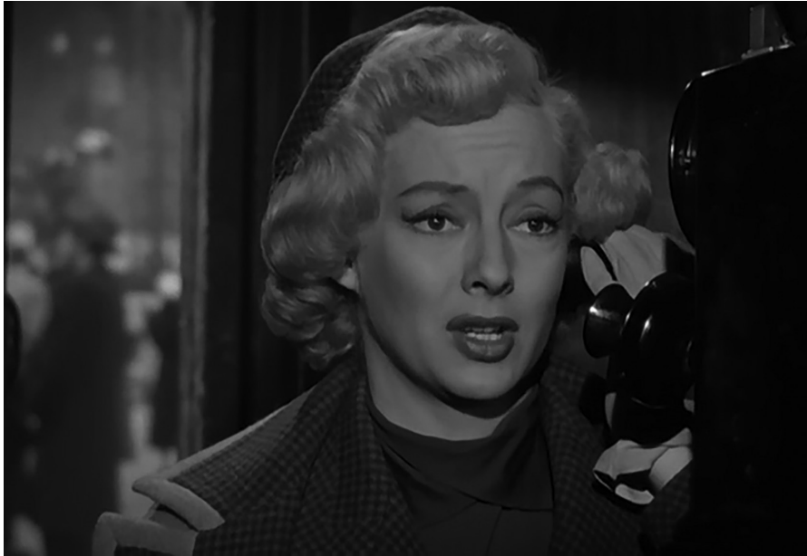
Fotograma 1. Portador asintomático (casi)