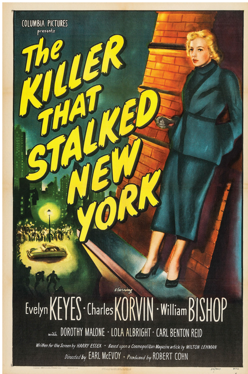
Cartel norteamericano Acción: Nueva York (EEUU). Época 1947