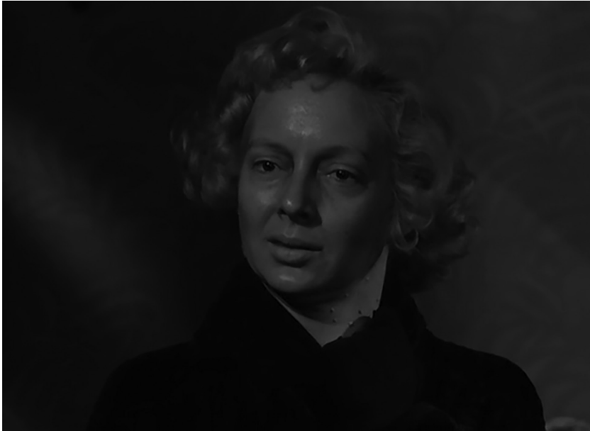
Fotograma 5. Exantema y muy mal estado general