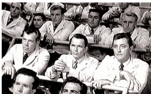
Foto 1: los protagonistas masculinos, ya mayorcitos, en una clase

Síntesis: Un estudiante de medicina, Lucas (Robert Mitchum) (foto 1), ambicioso pero falto de dinero, se casa con la enfermera de quirófano Cristina (Olivia de Havilland) (foto 2) para que le pueda pagar los costes de sus estudios. Cristina ama a Lucas pero éste sólo ama a su trabajo. Emocionalmente es una persona que no se abre a los demás, ni siquiera a su mejor amigo (Frank Sinatra) o a su padre alcohólico (Lon Chaney Jr.). Finalmente comenzará a trabajar para un rudo pero sensible médico general (Charles Bickford). El fallecimiento de ese colega, convertido en repentino paciente de Lucas, obliga a este a recapacitar y reordenar su vida.