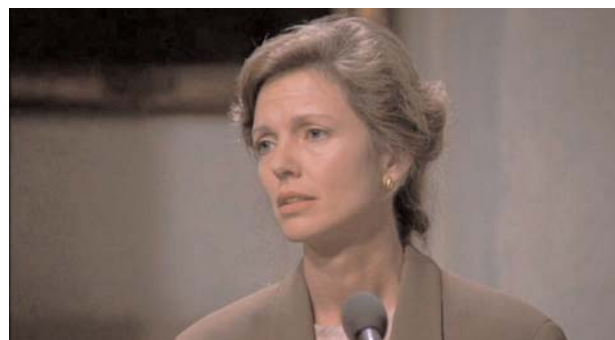
Foto 1: testigo que adquirió la infección por el VIH por una transfusión

En lo referente a los receptores de transfusiones sanguíneas, una de las testigos del juicio, una empleada del bufete en otra ciudad, también estaba infectada por el VIH y había desarrollado SIDA. Esta testigo se había contagiado después de dar a luz, ya que había perdido mucha sangre y necesitó transfusiones, que resultaron estar infectadas (foto 1).