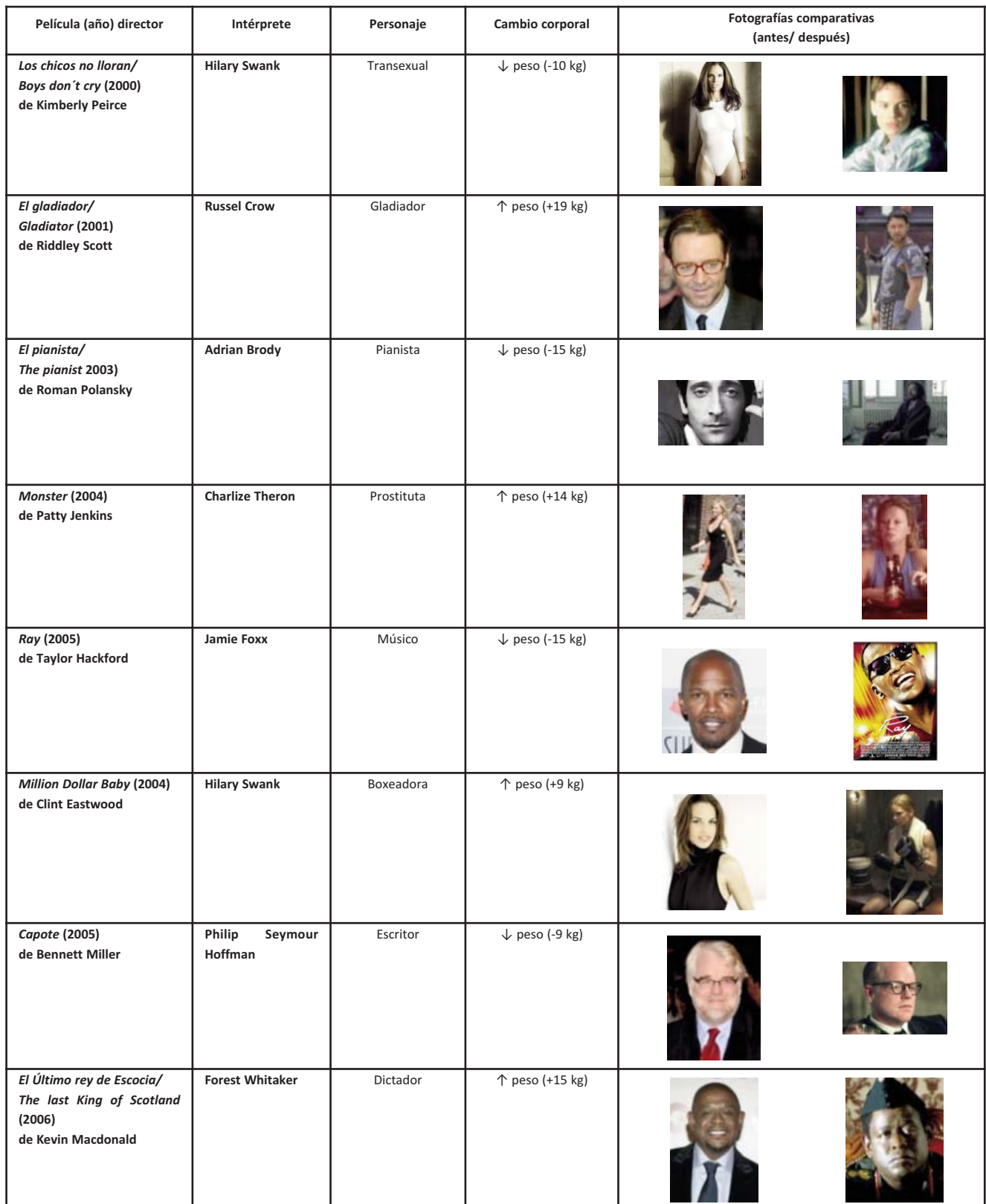
Tabla 3. Intérpretes ganadores de los Oscar que modificaron su peso corporal.