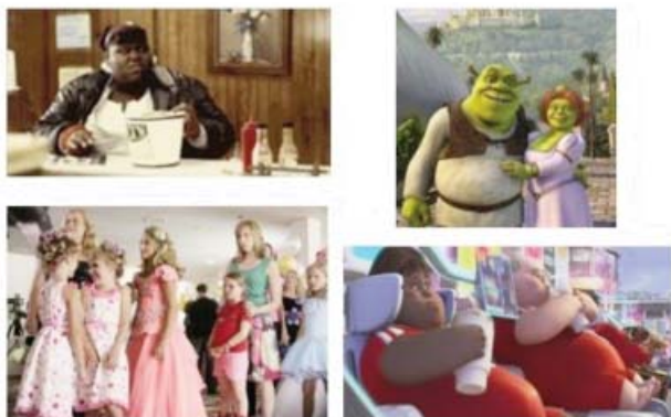
Foto 1. Personajes representativos de películas que muestran obesidad y sobrepeso. 2a/ Precious . 2b/ Shrek . 2c/ Pequeña Miss Sunshine . 2d/ WALL-E .