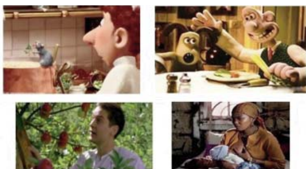
Foto 2. Personajes representativos de películas relacionadas con los alimentos y la nutrición. 3a/ Ratatouille . 3b/ Wallace & Gromit . 3c/ Las normas de la casa de la sidra . 3d/ Tsotsi .

Como se ha descrito, la última fase del estudio descriptivo presentado en nuestro análisis se caracteriza por la observación de los cambios corporales que ciertos actores han tenido que sufrir para ajustarse a los papeles que iban a interpretar. En lo concerniente a esta parte de análisis, destacar la importancia que actores/actrices tienen en nuestra sociedad, siendo verdaderos iconos de la cultura de todos los tiempos y especialmente en la actual. Debida a esta premisa, los cambios de peso encontrados en este estudio por el papel a interpretar podrían ser contemplados como un patrón de conducta a seguir por sus seguidores, especialmente si éstos últimos son individuos jóvenes, más vulnerables. En ocasiones los intérpretes no siguieron un adecuado control en la ganancia o pérdida de peso, obteniendo dicho cambio de imagen demasiado rápido o por una vía poco saludable. Esto podría incentivar a algunos sectores poblacionales al seguimiento de metodologías dietéticas poco adecuadas, al uso de inapropiados suplementos nutricionales, al abuso de laxantes y diarreicos, incluso al tratamiento hormonal (anabolizantes) para incrementar la masa muscular. Los riesgos para la salud pueden ser múltiples en cualquiera de estas circunstancias.