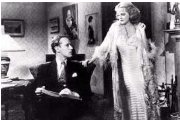
Foto 2. Philip Carey (Leslie Howard) y Mildred Rodgers (Bette Davis) los protagonistas de Cautivo del deseo .

Las primeras secuencias se focalizan en el viaje que Philip Carey realiza desde París hacia Londres, tras haber sido desestimado como pintor en la Ciudad Luz. Decidido a estudiar Medicina, como su padre, la acción se traslada al Hospital londinense de San Bartolomé en el que Philip, ya estudiante, es abochornado por su profesor quien lo invita a exponer públicamente ante sus compañeros el caso de un joven paciente con pie en garra congénito (equinovaro), que es lo que afecta a su propio pie derecho. Siguiendo una cadena interminable de desdichas recalca en una cafetería donde proseguirá lesionando hasta la exasperación su previamente afectada autoestima, al enamorarse perdidamente de la camarera Mildred Rodgers (Foto 2). Ella, con perversidad, le hace creer que le corresponde cuando, en realidad, ejerce sobre él un influjo poderoso y destructivo a través de ese mentido amor. En ese contexto, Philip abandona a Norah, su novia formal, y enredado en sentimientos de dependencia y humillación, congruentes con el título del filme y el de la novela original, se aferra a Mildred quien, además de tener una hija de otro hombre, lo somete una y otra vez a su desprecio.