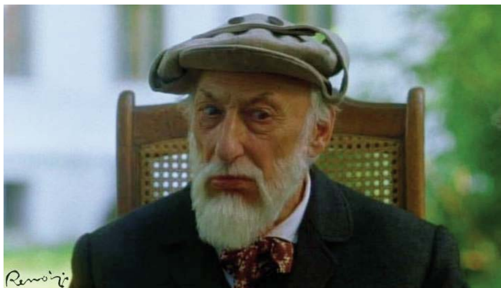
Auguste Renoir (1841-1919)...