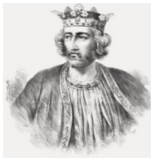
Foto 13: Edward I (Ilustración de Cassell's History of England. Century Edition. Publicado alrededor de 1902)

Se inicia un largo proceso por el que hasta catorce nobles escoceses reclaman la Corona, si bien pronto quedan sólo dos aspirantes, John Balliol y Robert V the Bruce, abuelo del joven Robert que sería Rey de Escocia. En este largo proceso que se ha llamado “la