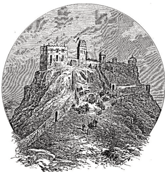
Foto 12: Castillo de Edimburgo antes de 1573 (Ilustración de Grant J. Cassell's Old and New Edinburgh, Vol. 1, Londres: Cassell & Co; 1880s)

Había estado casado con la hermana de Edward I de Inglaterra, con la que tuvo tres hijos,