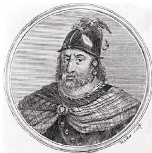
Foto 15: William Wallace (grabado de finales del siglo XVII o del XVIII)

Sus primeros años de vida transcurrieron en un país tranquilo e independiente con relativa prosperidad económica. En sucesivas etapas de su vida recibió