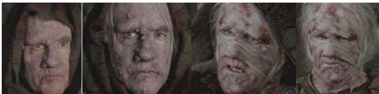
Foto 6: evolución de la lepra de Robert Bruce El leproso (Ian Bannen) en distintas secuencias de la película

El personaje desde el punto de vista ético es más que reprochable, pero llama mucho la atención tanto por tener lepra, enfermedad siempre un tanto misteriosa y temible, como por su habilidad para la intriga y la maquinación.