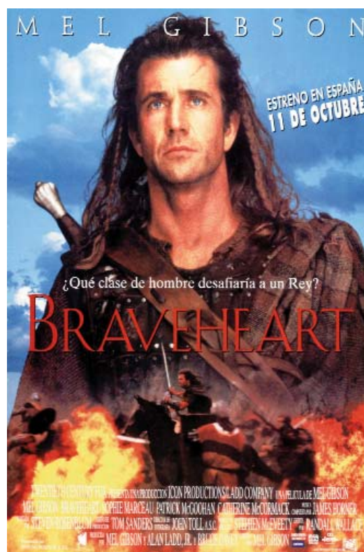
Cartel español con William Wallace (Mel Gibson), el protagonista de la película

por qué pocas personas son susceptibles de padecer las formas clínicas más graves de la enfermedad e incluso de padecerla en cualquiera de sus formas 6,7 . El mito de la gran contagiosidad de la lepra quedaba roto para siempre. Un poco más se retrasó la curación de la lepra, pues tras los primeros éxitos con la Dapsona en la década de los cuarenta, pronto se vio que la recurrencia de la enfermedad era la norma, no fue hasta la década de los ochenta cuando con un tratamiento politerápico con Dapsona, Rifampicina y Clofazimina se lograron curaciones definitivas 7-10 .