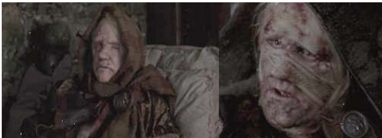
Foto 21: la forma clínica de la lepra de la película parece lepromatosa

que el llamado G. P. es leproso confirmado. Por lo cual será bueno que sea separado de la compañía de los sanos, dado que este mal es contagioso.