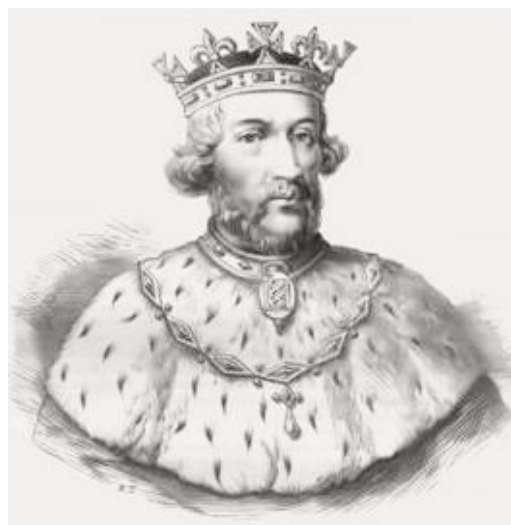
Foto 18: Edward II (ilustración de Cassell's History of England. Century Edition. Publicado alrededor de 1902)

Falleció en 1329, de lepra. Es tradición que, viéndose moribundo, expresó su deseo a sir James Douglas, su lugarteniente y amigo, de que su corazón le fuera extraído y llevado a Tierra Santa a combatir contra los mahometanos, para obtener el perdón por sus pecados (cuando mató a John Comyn fue excomulgado) ya que, según algunos historiadores, pensaba que su enfermedad era un castigo por ellos. James Douglas, murió en la batalla de Teba en Andalucía, en la que participó bajo el mando del rey Alfonso XI y a la que acudió con el corazón de Robert I. Después el corazón fue devuelto a Escocia y enterrado en la abadía de Melrose.