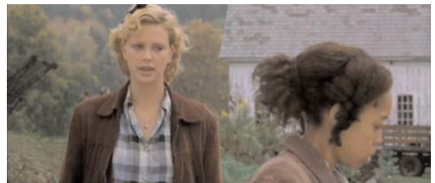
Foto 7: Candy explica a Rose su experiencia (aborto) e intenta ayudarla

de una gestación. Ante la presencia de vómitos, Homer sospecha su estado y le pregunta de cuánto está y si lo sabe, en clara alusión a su embarazo. Después de admitirlo, Rose plantea en voz alta el problema que la atormenta: ¿Qué voy a hacer con un bebé? No puedo tenerlo . Homer le pide que no haga nada ella sola y le ofrece su ayuda: Si decides no quedarte con el bebé, sé donde puedes llevarlo . Tan pronto Candy conoce el estado de Rose, le cuenta que ella también se quedó embarazada hace un año y le ofrece ayuda: Si no quieres tener el bebé, Homer te llevará a un lugar donde estarás segura... (foto 7). Cuando le pregunta sobre la paternidad del futuro bebé, la mirada de la joven (excelente ejemplo de comunicación no verbal), descubre que su embarazo es fruto de la relación incestuosa y no deseada con su padre, el Sr. Rose.