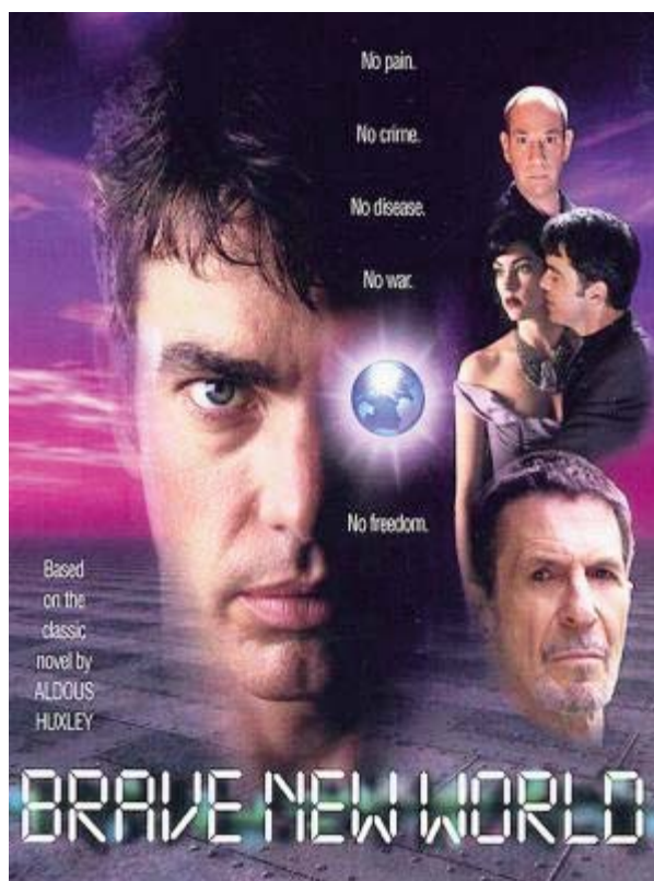
Foto 4: Un mundo feliz (1998) de Leslie Libman y Larry Williams (Cartel americano)

si todas las vidas biológicamente humanas tienen que ser respetadas de la misma manera. No se trata, por lo tanto, de un problema biológico, sino fundamentalmente filosófico, porque la biología no puede dar respuesta a las preguntas, ¿qué es persona? y, ¿quién es