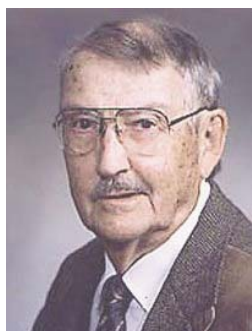
Foto 1: Van Renssealer Potter (1911-2001)

El cine es una forma de narrativa particularmente adecuada para la reflexión bioética, que se ocupa de relacionar el conocimiento biológico de los sistemas vivos con los valores éticos 1 . El neologismo “bioética” se debe a Van Renssealer Potter (foto 1) -investigador de la Universidad de Wisconsin- y aparece primero en un artículo en 1970 y después en 1971, en el libro titulado Bioethics: Bridge to the future 2 . Con una visión amplia, el autor se preocupa por la supervivencia de la especie humana y advierte del peligro que representan para la vida del planeta los avances tecnológicos, por lo que se hace necesario tender un puente entre dos culturas: las ciencias y las humanidades. Actualmente la bioética se ocupa de áreas muy diversas, desde una “macrobioética” relacionada con la globalización y el medio ambiente, hasta otra “microbioética”, que se puede subdividir en una ética de las biotecnologías y en otra que es propia de la medicina, aplicada a la investigación o a la asistencia clínica. La Isla aborda todos esos campos. En la película se dice que la contaminación ha provocado la destrucción de la mayor parte del mundo, un desastre ecológico que tiene que ver con la bioética propuesta por Van Potter. También están presentes la bioética de las biotecnologías (con la clonación humana reproductiva) y la bioética clínica (con el trasplante de órganos procedentes de donante vivo).