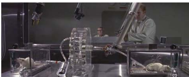
Foto 4: determinando el tamaño infectivo de Andrómeda . Se hace pasar el aire a través de una rueda de filtros con diferente tamaño de poro.

Una vez aislado el microorganismo alienígena recibe un nombre: Andrómeda . La composición de la sustancia verde es analizada bioquímicamente y microbiológicamente. Andrómeda es cultivado en diversas condiciones y medios de cultivo: agar sangre, agar chocolate, extracto de levadura, etc. Está compuesto de carbono, nitrógeno, oxígeno e hidrógeno en proporciones similares a los seres vivos terrestres, pero al realizar un análisis de aminoácidos y de ácidos nucleicos encuentran que no los tiene. Se hacen predicciones de su posible expansión en base a estudios de armas biológicas. Poco a poco van haciendo avances y así encuentran que Andrómeda es