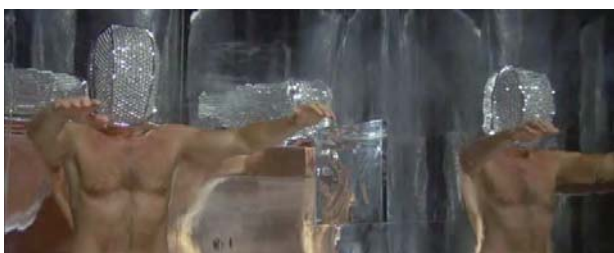
Foto 3: procedimientos de descontaminación. Fotoincineración de la piel.